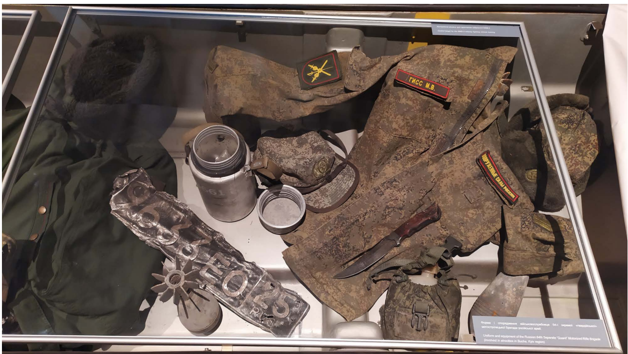
Додаток 3. Літня польова куртка військовослужбовця Збройних сил Російської Федерації Гісса М.В. 2022 р.

В експозиції вже згаданої виставки «Україна – розп'яття» представлені форма і спорядження одного з військовослужбовців 64-ї окремої гвардійської мотострілецької бригади, на прізвище Гісс, знайдені під час музейної експедиції 10 квітня 2022 р. до місць боїв на північних околицях смт Макарів Бучанського району Київської області [36] (Додаток 3).