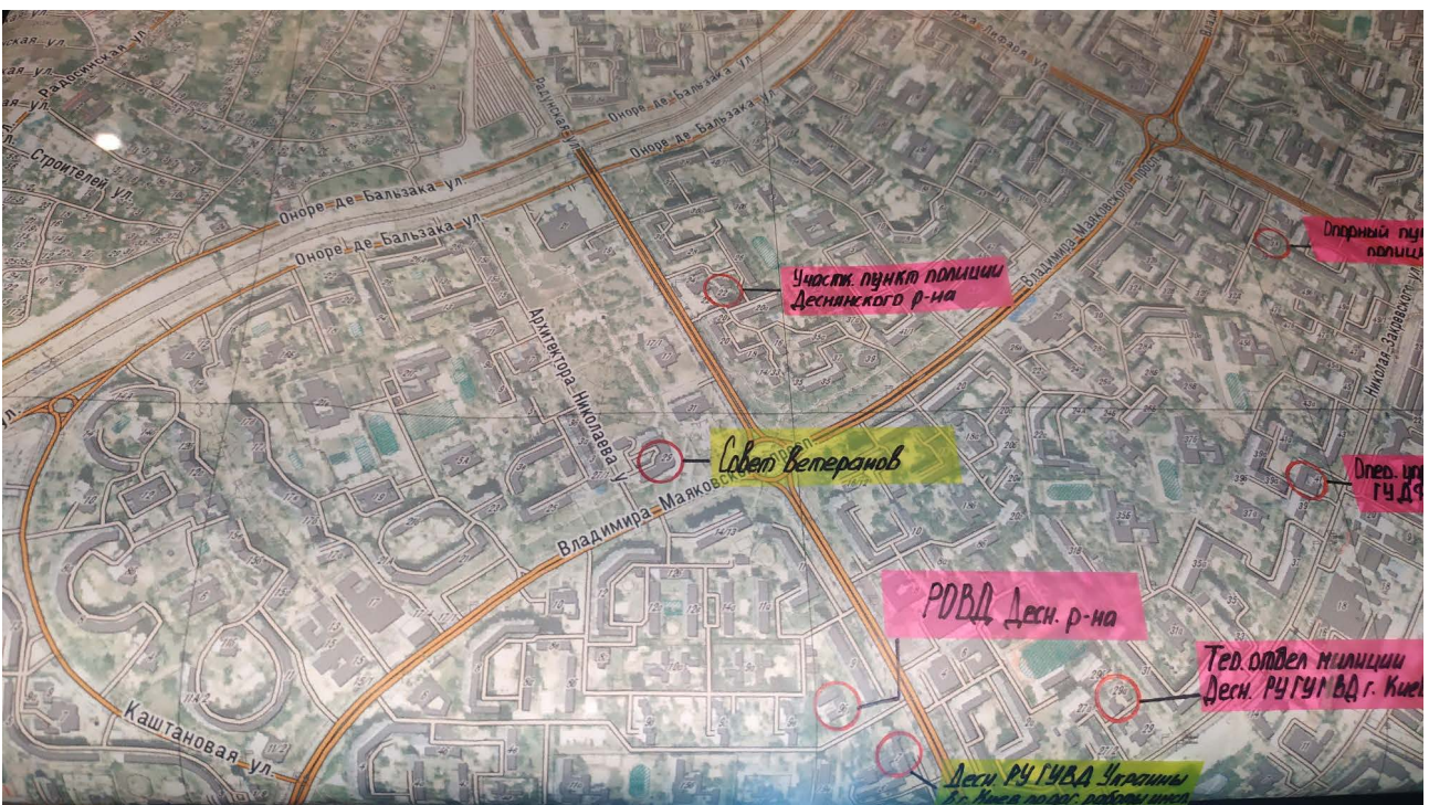
Додаток 2. Робоча карта Дарницького району, яку використовували диверсійно-розвідувальні групи. м. Київ. 2022 р.