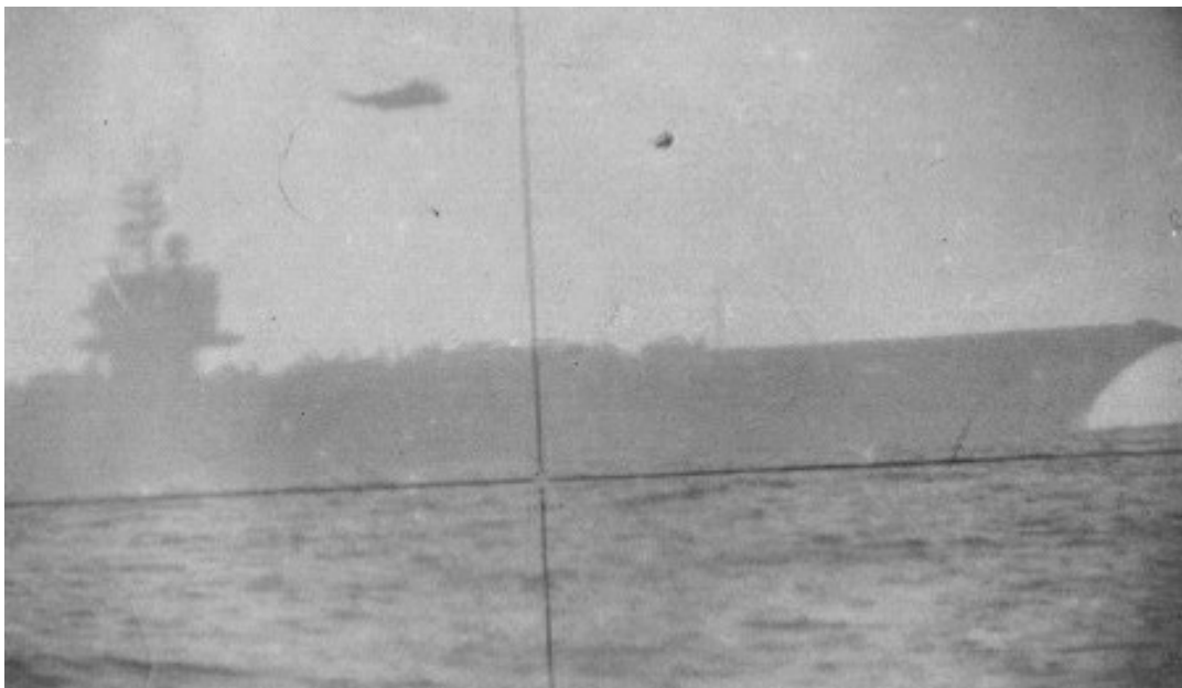
У перископі CVN-65 «Enterprise» перед нашим розставанням

Провівши превентивний відрив від можливого стеження, зайняли позицію з іншого борту «Enterprise», оскільки кораблі ескорту теж були пов'язані в маневрі.