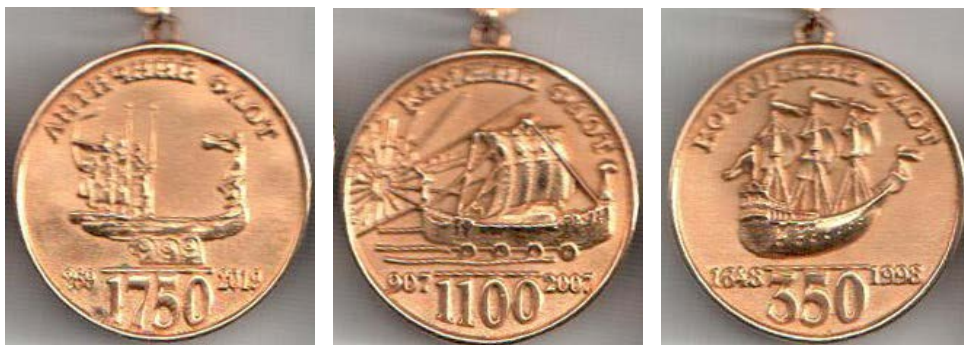
Рис.8. Медаль «Морська слава України» (реверс) Зліва направо: 1 ступінь, 2 ступінь, 3 ступінь

Наступний проект «Морська слава України» (див. рис. 6 – 7) був запроваджений «Братством моряків України» (президент – контр-адмірал Микола Костров), виконаний у двосторонньому варіанті (аверс і реверс) трьох ступенів, що дало змогу поєднати дати визначних перемог над трьома імперіями (Римською, Візантійською, Османською) прадавніх українських флотів (Античного, Княжого, Козацького) із славетними звитягами відроджених Військово-Морських сил України, а саме океанськими походами фрегата «Гетьман Сагайдачний», проривом СКР-112, попри збройну протидію «каساتонівських» кораблів, плаванням сучасної козацької чайки «Пресвята Покрова» впродовж 15 кампаній у навколишніх європейських морях та безпосередньо в Атлантичному океані. Нагорода також має статут [12, 206 – 207, 313 – 315; 13].