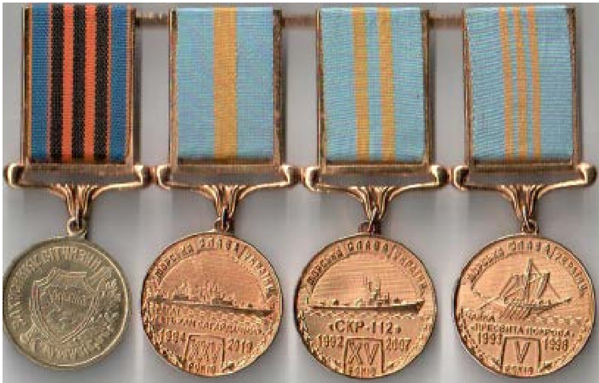
Рис. 7. Медалі «Захисник Вітчизни» та «Морська слава України»

Наступний проект «Морська слава України» (див. рис. 6 – 7) був запроваджений «Братством моряків України» (президент – контр-адмірал Микола Костров), виконаний у двосторонньому варіанті (аверс і реверс) трьох ступенів, що дало змогу поєднати дати визначних перемог над трьома імперіями (Римською, Візантійською, Османською) прадавніх українських флотів (Античного, Княжого, Козацького) із славетними звитягами відроджених Військово-Морських сил України, а саме океанськими походами фрегата «Гетьман Сагайдачний», проривом СКР-112, попри збройну протидію «каساتонівських» кораблів, плаванням сучасної козацької чайки «Пресвята Покрова» впродовж 15 кампаній у навколишніх європейських морях та безпосередньо в Атлантичному океані. Нагорода також має статут [12, 206 – 207, 313 – 315; 13].