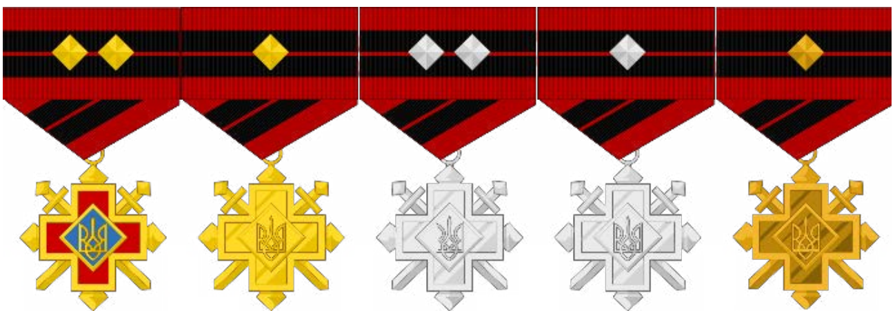
Рис. 3. Відзнаки Бойового Хреста Заслуги УПА

Знехтувана пам'ять про селянську армію Нестора Махна, січових стрільців Симона Петлюри, червоних козаків Думенка, Пархоменка та Щорса, а також братовбивчої громадянської війни та подвиг Героїв Крут! Знехтувана пам'ять про воїнів-українців, що полягли на полях Першої світової війни, воюючи в Українському легіоні січових стрільців Австро-угорської армії та українізованих частинах російської армії. Нарешті, знехтувана пам'ять і про українських козаків та княжих дружинників.