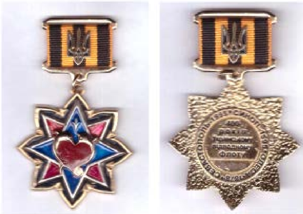
Рис. 6. Орден «Зірка Командора»