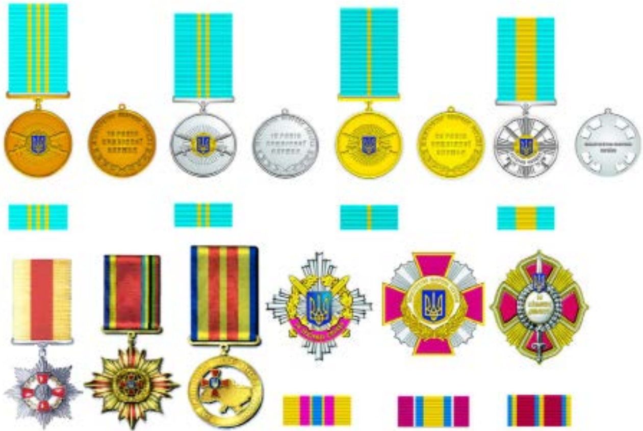
Рис. 4. Сучасні відзнаки Міністерства оборони України

Виняткове місце належить медалі «Захиснику України», у якій, на відміну від президентської нагороди «Захиснику Вітчизни», врахована і міфологічна історія, і сучасність (див. рис. 5).