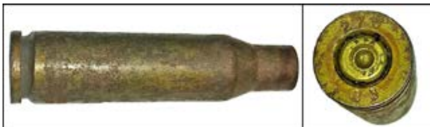
Гільза калібру 5,45 мм [55].

На гільзах, які виготовлено у XXI ст., маркування року випуску теж складається із двох цифр. Наприклад, на зображеній нижче гільзі позначення «03» означає 2003 р.