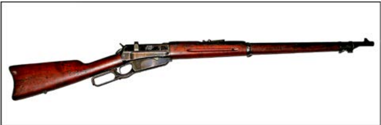
Гвинтівка Winchester M1895 [20].

Таку зброю більшість людей бачила зазвичай в американських вестернах. До речі, ця гвинтівка має досить цікаву історію появи на теренах України та бойового застосування тут. У роки Першої світової війни американська компанія Winchester уклала контракт на постачання цієї зброї для Російської імператорської армії під патрон калібру 7,62 мм. Після завершення війни й повалення монархії в Росії ці гвинтівки тривалий час зберігалися на складах Червоної армії [3, 26]. Із початком німецько-радянської війни «вінчестери» надійшли до частин народного ополчення й застосовувалися в боях, зокрема й на підступах до м. Київ.