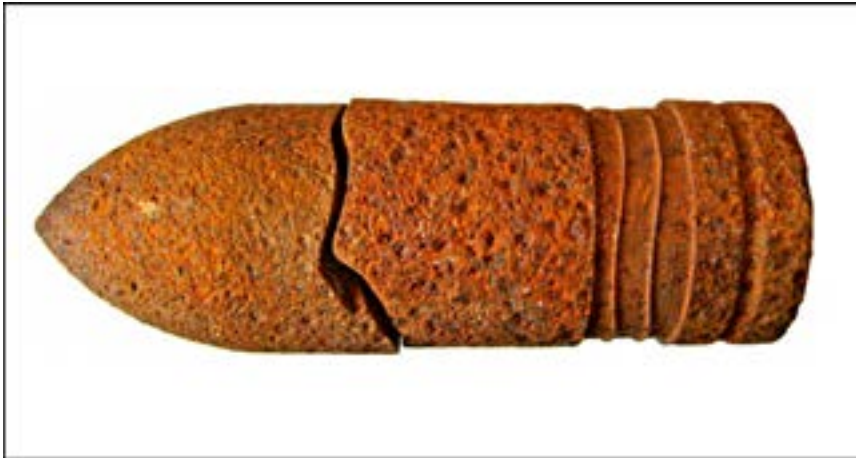
Бронебійний снаряд калібру 57 мм [51].

(«Черчилль»), Matilda («Матільда») і Valentine («Валентайн»). За програмою ленд-лізу певну кількість цих танків було надано Червоній армії. Чимало з них справді брали участь у боях за Київщину восени 1943 р.