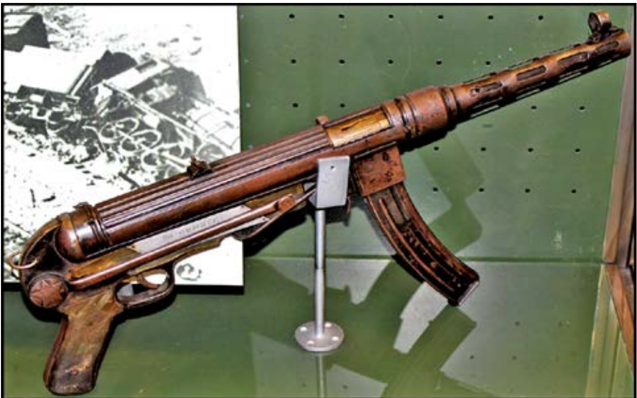
Саморобний пістолет-кулемет Героя Радянського Союзу Давида Бакрадзе [27].

У фондах є як заводські зразки вогнепальної зброї, так і екземпляри, що їх виготовляли власноруч деякі учасники бойових дій, зокрема представники руху Опору. Якщо для перших характерні маркування, висока якість матеріалу, хороше виконання, то останнім, навпаки, зазвичай притаманні грубе виконання, відсутність будь-яких маркувань у вигляді клейм, інших позначень, низька якість деталей, які часто доводилося створювати кустарним способом у польових умовах. У фондозбірні Меморіалу зберігається пістолет-кулемет, що був виготовлений білоруськими партизанами й подарований Герою Радянського Союзу Давидові Бакрадзе – командирові полку 1-ї Української партизанської дивізії. Ця зброя є симбіозом підручних засобів. Ствол був узятий із пошкодженої гвинтівки, кожух ствола – з велосипедної труби, задня частина ствола – з водопровідної труби, пружини – з підбитого літака тощо. Хоча слід зауважити, що в умовах масового воєнного виробництва на збройних заводах і СРСР, і багатьох інших країн – учасниць війни теж застосовувалися такі конструктивні рішення. Випуск продукції мав на меті створення якомога більшої кількості зброї при найменших затратах коштів і матеріалів. Відомий британський пістолет-кулемет Sten, який є у фондах Меморіалу, причому в кількох екземплярах, теж виготовлявся з англійських водопровідних труб. Конкретно з них робили затворну коробку, що поступово переходила в кожух ствола, а також приклад [5, 29–30].