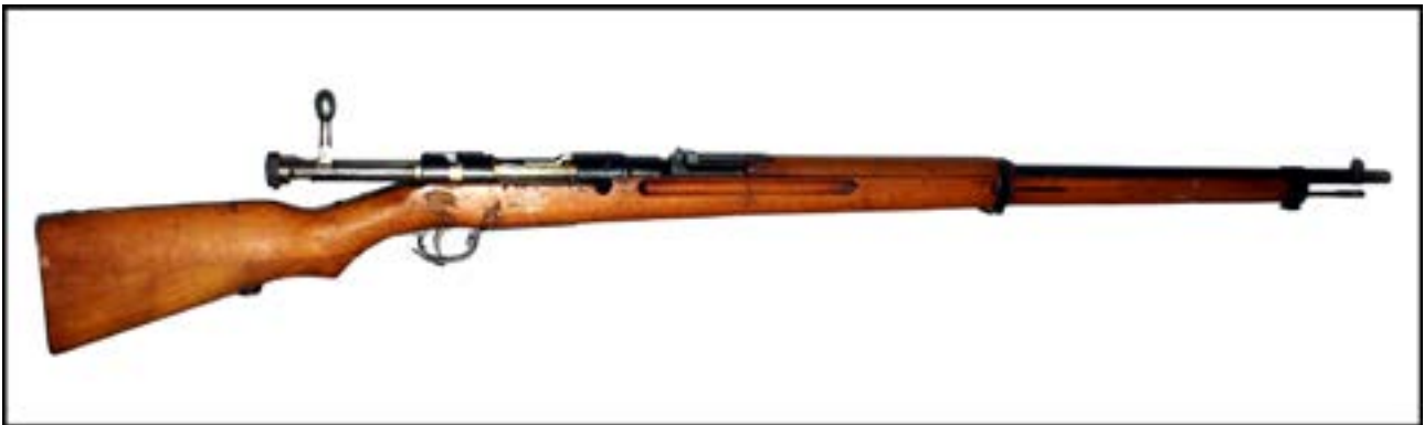
Гвинтівка Arisaka Type 38 [19].

Японська імператорська армія була озброєна гвинтівкою Arisaka Type 38. На фото нижче – трофей, захоплений у Квантунської армії.