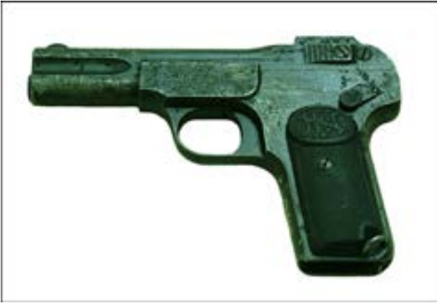
Пістолет Browning M1900 [26].