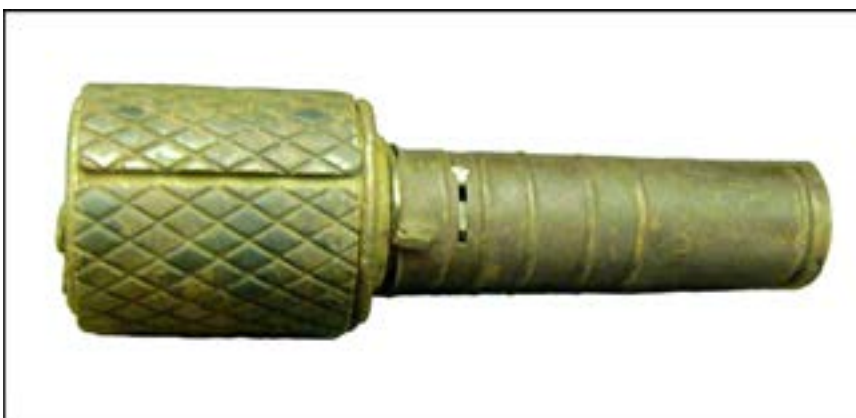
Ручна граната РГД-33. Зал № 3 [39].

У Червоній армії однією з найпоширеніших була РГД-33 – ручна граната Дьяконова зразка 1933 р. Досить часто на ці гранати встановлювали так званий оборонний чохол (інша назва «сорочка»). Це металева насадка з помітними ромбоподібними поділками для утворення якомога більшої кількості осколків під час вибуху. Досить значна кількість цих сорочок були скомплектовані співробітниками, і нині вони представлені в експозиції або зберігаються у фондах.