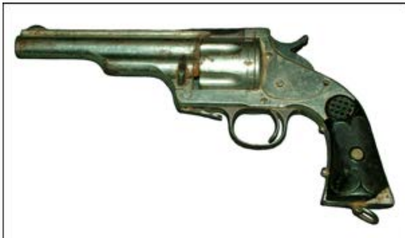
Револьвер Merwin & Hulbert Frontier 4th Model [14].

Серед інших цікавих зразків цього періоду, які використовували афганці в боротьбі з радянськими військами, був американський револьвер Merwin & Hulbert Frontier 4th Model, виготовлений між 1887 та 1891 рр. Це доволі рідкісна зброя, ціна якої на сучасних аукціонах сягає 1000 доларів США.