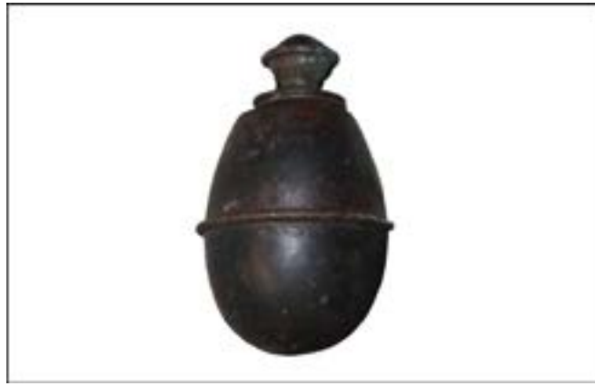
Ручна граната Eihandgranate M39. Зал № 1 [31].

Загалом цікаво, що завдяки наявним у фондах зразкам озброєння та боеприпасів ми можемо висвітлити чи не кожен військовий конфлікт ХХ ст. Зокрема, чимало трофеїв надійшло з Афганістану. Вражає як кількість, так і різноманіття зразків озброєння бійців афганської опозиції. Це зброя різних епох та країн-виробників, що стала цінними експонатами фондової колекції. Насамперед варто відзначити зразки часів британської колоніальної експансії, такі як карамультук з ударно-капсульним замком другої половини ХІХ ст., а також пістолет Enfield, що має той самий принцип дії і виготовлений також у другій половині ХІХ ст.