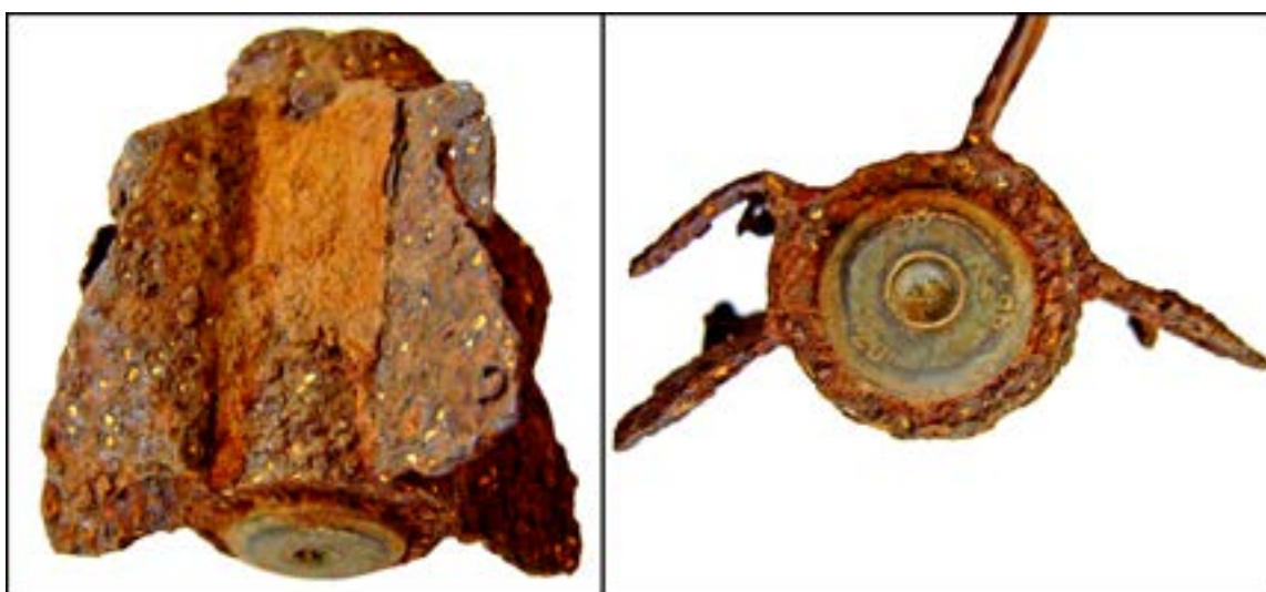
Стабілізатор для радянської міни О-832 калібру 82 мм [45].

Наприклад, у зображеного нижче стабілізатора для радянської міни О-832 калібру 82 мм помітні маркування у вигляді цифр «58», «20» і «39». Цифра «58» – це позначення Московського дроболиварного патронного заводу ім. К.Є. Ворошилова, «20» – діаметр вибивного патрона в міліметрах, «39» – рік випуску.