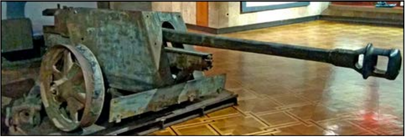
75-мм протитанкова гармата PaK 40. Зал № 12 [40].