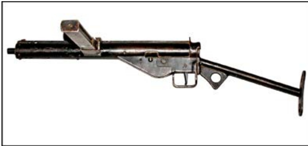
Пістолет-кулемет Sten Mk.III [11].

Фондозбірня багата й на інші зразки таких артефактів. Зокрема, в ній є саморобний пістолет, який видається спробою скопіювати пістолет системи ТТ (Тульський Токарева). Уміщене нижче фото дає яскраве уявлення, наскільки просто виконаний зразок.