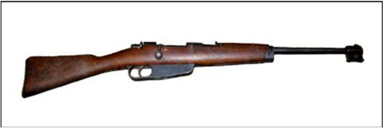
Карабін Mannlicher-Carcano M1891 da Cavalleria. Зал № 13 [25].

Японська імператорська армія була озброєна гвинтівкою Arisaka Type 38. На фото нижче – трофей, захоплений у Квантунської армії.