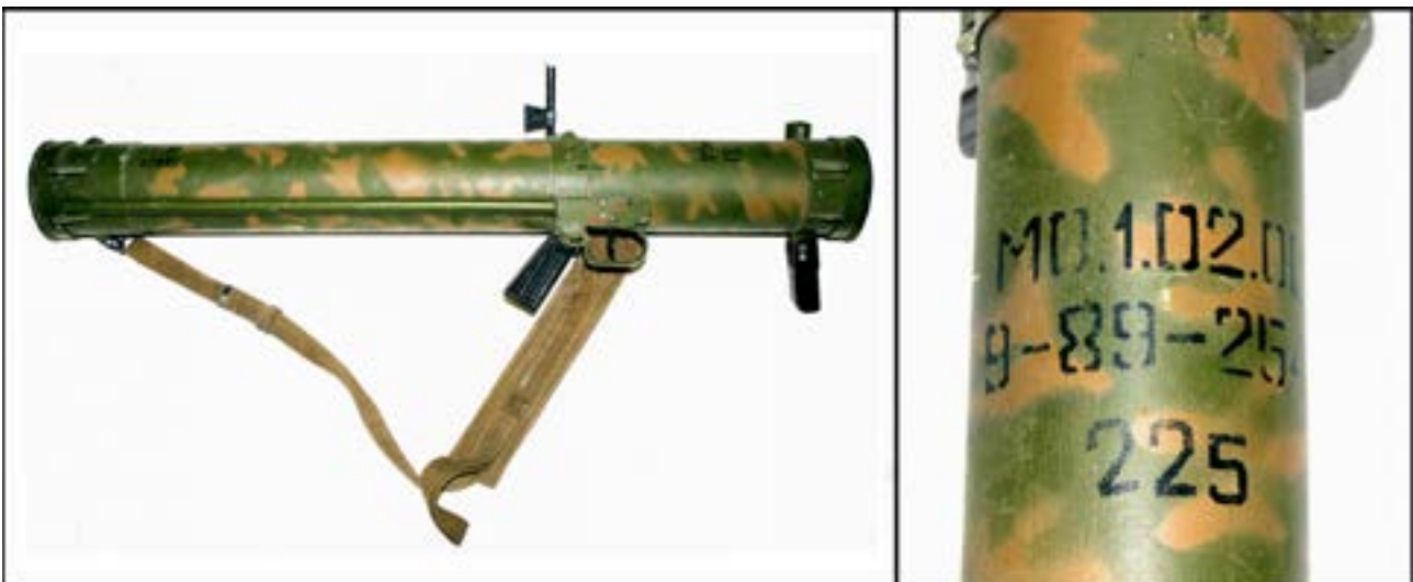
Пусковий пристрій ручного піхотного вогнемета РПО-А «Шмель» [34].

Наразі у фондозбірні є три вогнемети «Шмель», привезені з місць боїв на Сході України. Зображений нижче вогнемет був скомплектований співробітниками Музею під час відрядження до зони бойових дій. Він виготовлений у 1989 р., що підтверджує маркування.