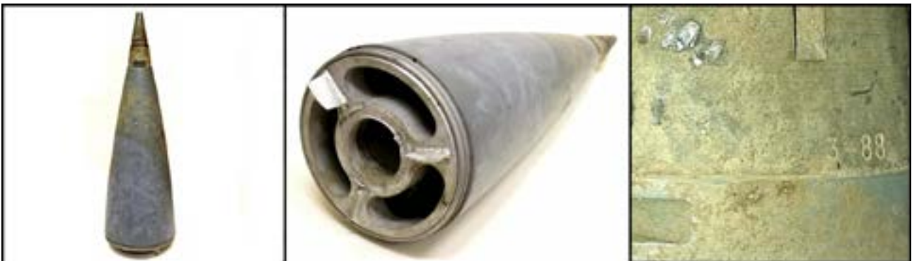
Носова частина з детонатором від реактивного снаряда РСЗО БМ-27 «Ураган» [50].

Досить часто дату створення можна розібрати й на фрагментах боєприпасів, вилучених на місцях артобстрілів. Так, на носовій частині з детонатором від реактивного снаряда РСЗО БМ-27 «Ураган», знайдений на місці обстрілу українських позицій у 2018 р. поблизу смт Луганське на Донеччині, помітно маркування «3-88», де «3» – номер партії, а «88» – рік випуску. Таку потужну смертоносну зброю, як БМ-27 «Ураган» застосовували обидві сторони. Лише після Мінських домовленостей установки були поступово відведені з позицій.