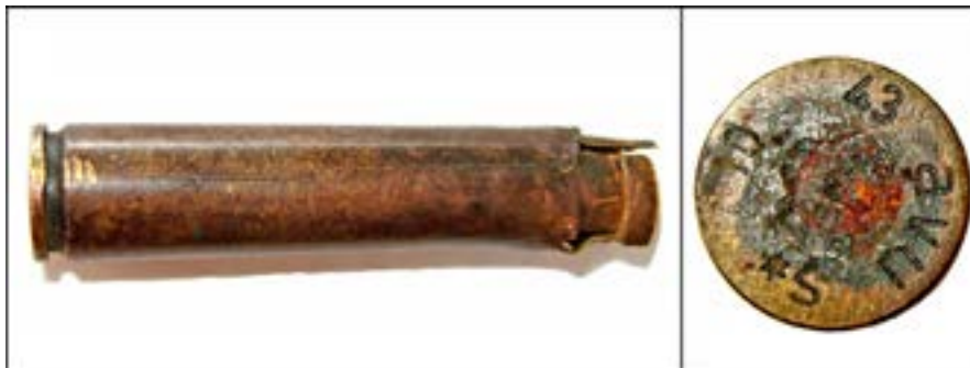
Гільза калібру 7,92 мм [52].

На денці гільзи воєнного періоду на світлині нижче помічаємо символи «ави», «S*», «10» і «43», де «ави» – позначення металообробного товариства «Зільва» в м. Гентін (нині – федеральна земля Саксонія-Ангальт), «S*» – підтвердження того, що гільза повністю виготовлена з латуні, «10» – номер партії, «43» – рік випуску.