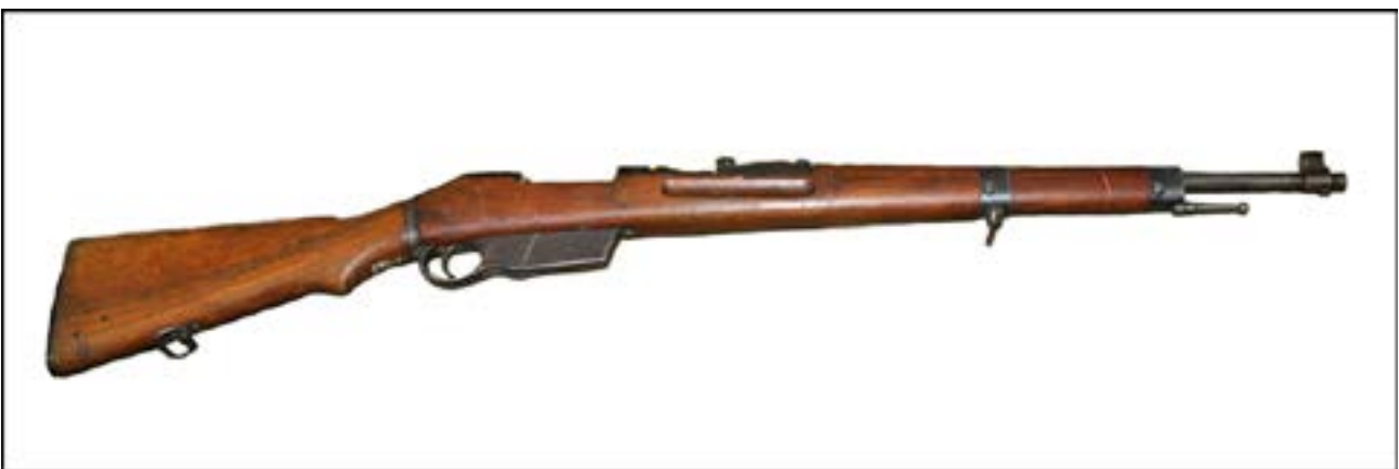
Гвинтівка FEG 35М. Зал № 13 [24].

Солдати Угорської королівської армії під час Другої світової війни користувалися гвинтівкою свого вітчизняного виробництва – FEG 35М. Італійські війська під час війни мали різні варіанти гвинтівки системи Манліхера – Каркано. Серед них варто відзначити карабін Mannlicher-Carcano M1891 da Cavalleria, призначений саме для кавалеристів. І угорську, й італійську гвинтівки можна бачити в експозиції залу № 13 Музею.