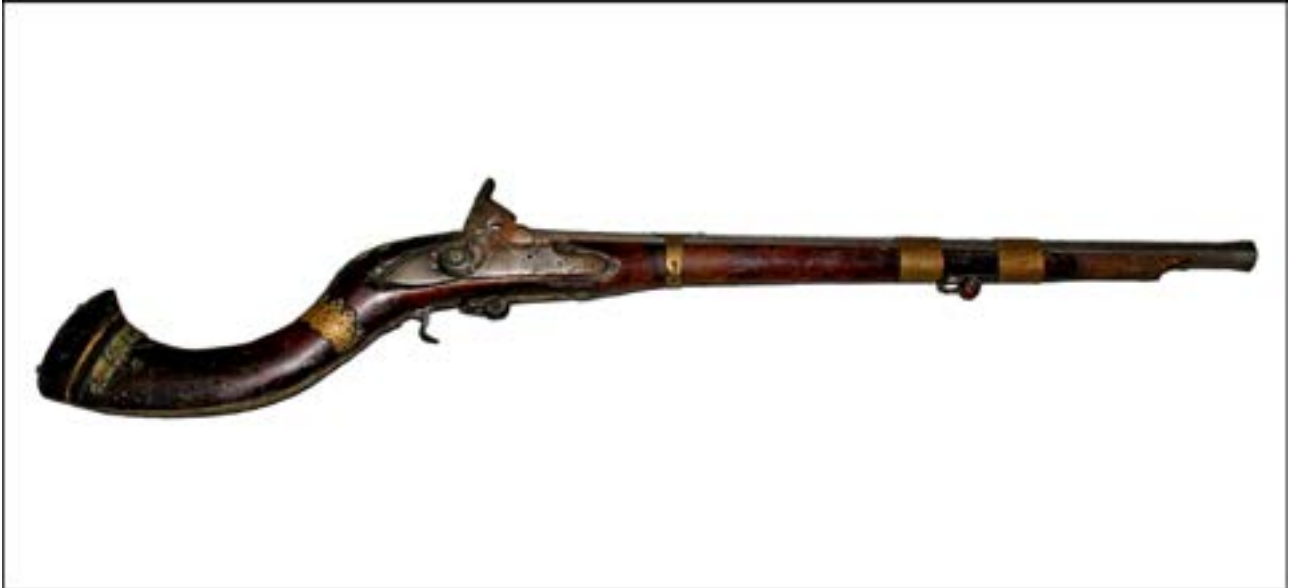
Карамультук з ударно-капсульним замком [12].

Загалом цікаво, що завдяки наявним у фондах зразкам озброєння та боеприпасів ми можемо висвітлити чи не кожен військовий конфлікт ХХ ст. Зокрема, чимало трофеїв надійшло з Афганістану. Вражає як кількість, так і різноманіття зразків озброєння бійців афганської опозиції. Це зброя різних епох та країн-виробників, що стала цінними експонатами фондової колекції. Насамперед варто відзначити зразки часів британської колоніальної експансії, такі як карамультук з ударно-капсульним замком другої половини ХІХ ст., а також пістолет Enfield, що має той самий принцип дії і виготовлений також у другій половині ХІХ ст.