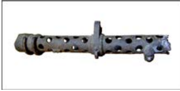
Фрагмент кожуха ствола кулемета MG-34 [42].