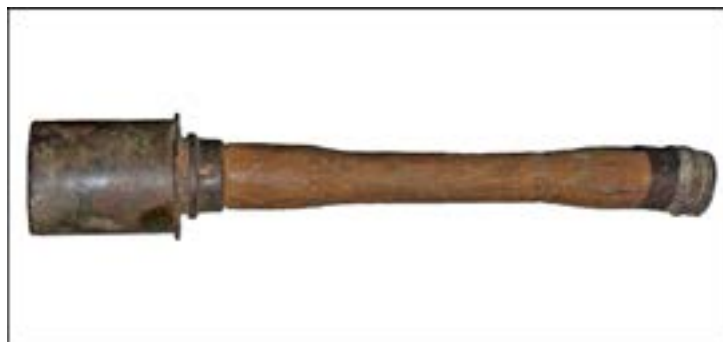
Ручна граната Stielhandgranate M24. Зал № 1 [30].

У німецькій армії найпоширенішою була граната з довгим дерев'яним руків'ям – Stielhandgranate M24. Вона хоч і не була потужною, проте її можна було кинути значно далі, ніж інші гранати. Один солдат військ СС установив рекорд, метнувши її на 70 м [57, 55]. Застосовували у Вермахті й гранату Eihandgranate M39, у перекладі – «яйцеподібна граната». Обидва зразки представлено в залі № 1 Музею.