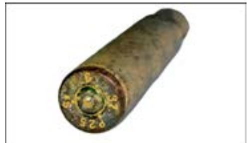
Гільза калібру 7,92 мм [48].

На денці гільзи, зображеної на знімку нижче, міститься маркування у вигляді символів «P25», «S*», «6» і «37». «P25» – це позначення заводу «Зебальдусгоф» у м. Троєнбрицен (нині – федеральна земля Бранденбург), «S*» – підтвердження того, що гільза повністю виготовлена з латуні, «6» – номер партії, «37» – рік випуску.