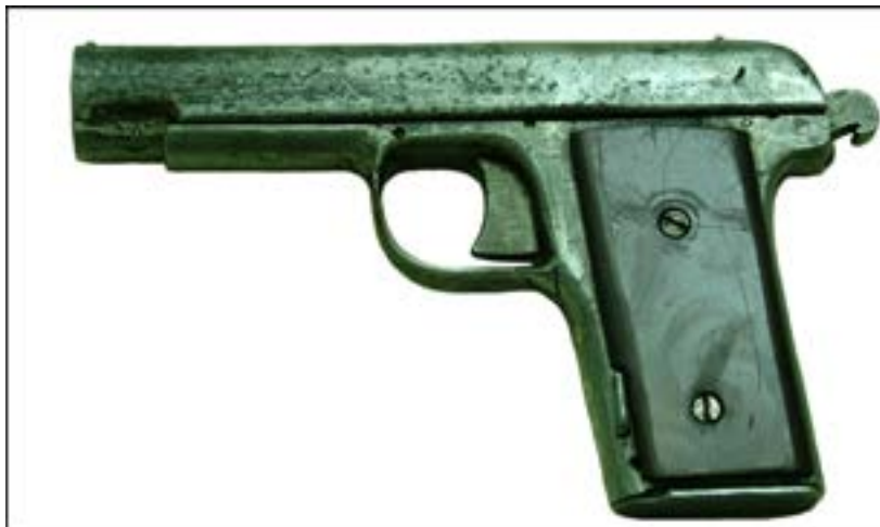
Саморобний пістолет [35].

Фондозбірня багата й на інші зразки таких артефактів. Зокрема, в ній є саморобний пістолет, який видається спробою скопіювати пістолет системи ТТ (Тульський Токарева). Уміщене нижче фото дає яскраве уявлення, наскільки просто виконаний зразок.