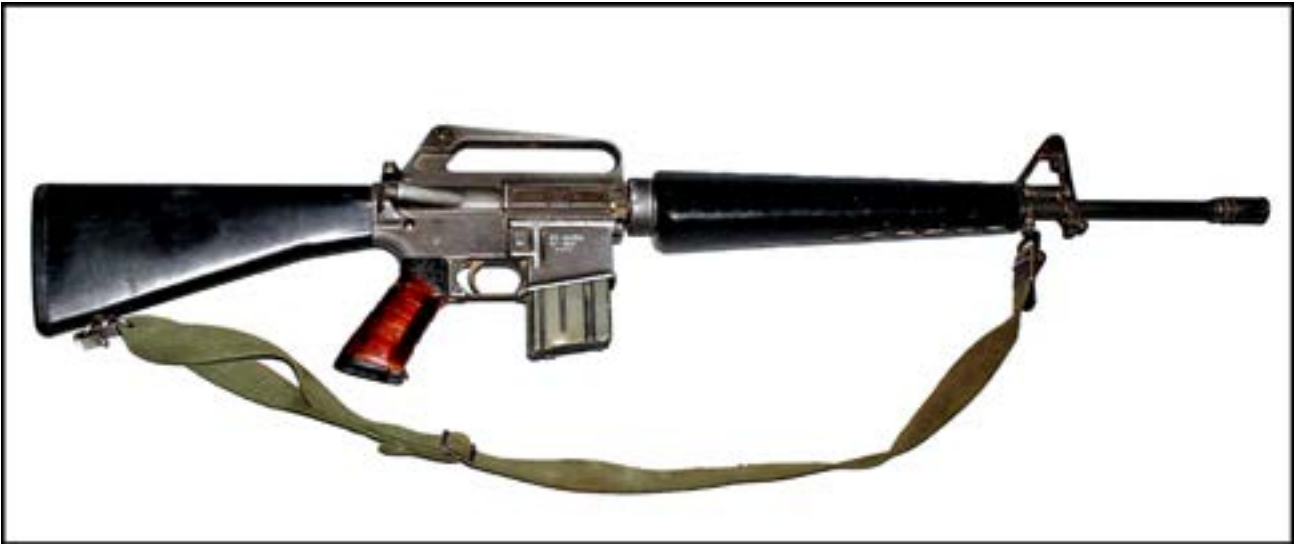
Штурмова гвинтівка M16 [13].