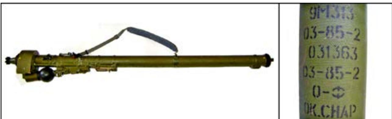
Пускова труба 9П322 переносного зенітно-ракетного комплексу 9К310 «Игла-1» [32].

На відбитих у проросійських бойовиків позиціях були вилучені й ПЗРК «Игла-1». Цю зброю постачали терористам із території РФ. Зокрема, відомо, що нею було збито кілька українських вертольотів та сумнозвісний Іл-76Д в Луганському аеропорту. Цей комплекс перебуває і на озброєнні ЗСУ, проте на Донбасі не застосовувався через відсутність достойних цілей. На фото нижче – екземпляр, вилучений під час спецоперацій у районі м. Дебальцеве. Принцип розшифрування маркування цього зразка такий самий, як і гранатометних пускових пристроїв: «9М313» – індекс ракети, «03» – номер партії ракети, «85» – рік виготовлення ракети, «2» – індекс заводу – виробника ракети, «031363» – обліковий номер ракети. Нижче вказані складальні дані, а також тип і стан бойової частини: «03» – номер партії складання, «85» – рік складання, «2» – індекс складального заводу, «О-Ф» – осколково-фугасна дія бойової частини, «ОК СНАР» – «окончательно снаряжённый», тобто готовий до застосування боєприпас.