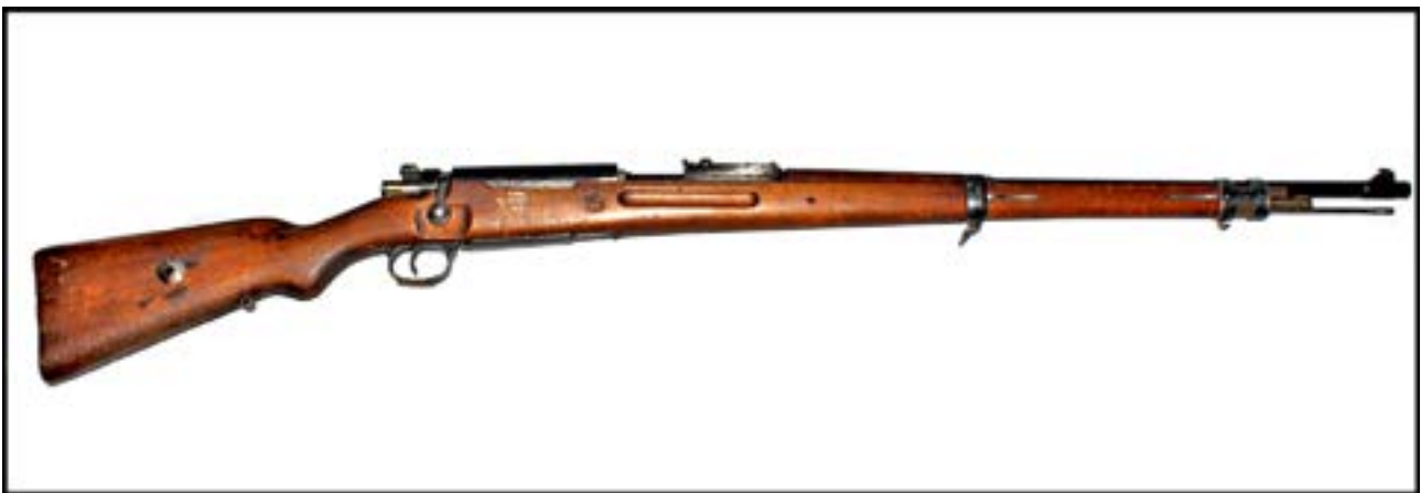
Карабін Mauser 98k [21].

Британська армія в Першій та Другій світових війнах застосовувала гвинтівку Lee-Enfield. Так само і французи в першій половині ХХ ст. використовували свою гвинтівку Lebel M1886. Цікаво, що обидва зразки надійшли до Музею як трофеї, захоплені в бійців збройної опозиції в Афганістані.