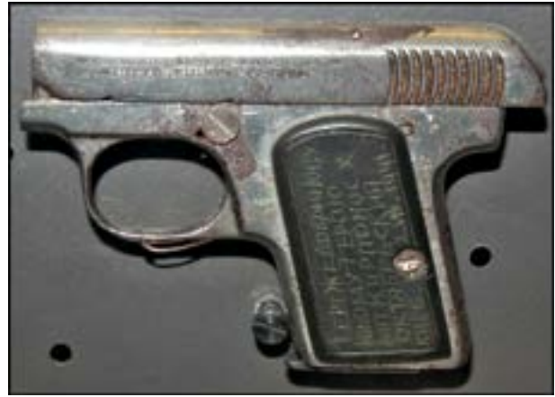
Пістолет Browning M1906. Зал № 3 [38].

Дуже часто зброя різних періодів випусків має свої конструктивні особливості. Відповідно ранні зразки дещо відрізняються від пізніших. Це можна продемонструвати на прикладі доволі цікавого незвичного чехословацького пістолета-кулемета ZK-383, який зберігається у фондозбірні. На музейному зразку на кожуху ствола є кільце для встановлення двоногої сошки. Ця особливість відрізняє зброю ранніх випусків. Пізніші зразки сошок не мали. Пістолет-кулемет ZK-383 почали виготовляти для армії Чехословаччини в 1938 р. Відомо, що із захопленням цієї країни Вермахт узяв на озброєння й певну кількість таких пістолетів-кулеметів [7, 234]. Очевидно, під час німецько-радянської війни нинішній музейний зразок був захоплений як трофей військовослужбовцем Червоної армії. Вирізьблені слова російською на прикладі «11 німецьких солдатів і один офіцер знищив М С» та 12 зарубок на зворотному боці свідчать про результативність бійця.