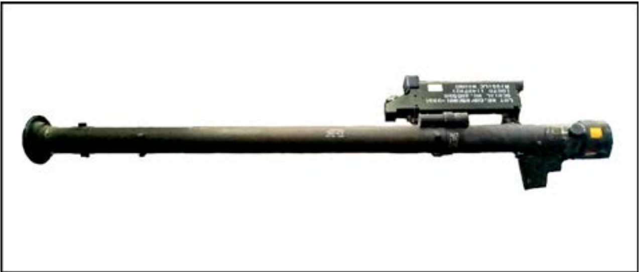
Пускова труба переносного зенітно-ракетного комплексу FIM-92 Stinger [17].

Як відомо, до Музею надходить велика кількість залишків озброєння та боєприпасів, пов'язаних із подіями сьогодення, а саме війною на Сході України. По суті, його співробітникам випала нагода способом детального дослідження предмета вкотре підтвердити російську присутність на Донбасі. Адже у фондозбірні є предмети, які не перебували на озброєнні українських формувань, натомість відомо, що такі зразки використовуються в російській армії. Серед них – ручний протитанковий гранатомет РПГ-26 «Аглень». Гранатомет виготовляється від 1985 р., але на озброєнні української армії не перебуває. Його основний виробник – це завод № 254 у м. Челябінськ, також відомий як Виробниче об'єднання «Сигнал». На маркуванні зображеного нижче гранатомета, знайденого в районі с. Гранітне Волноваського району Донеччини, помітні символи: «РПГ-26». Нижче – «254», це і є позначення вже згаданого заводу-виробника пускового