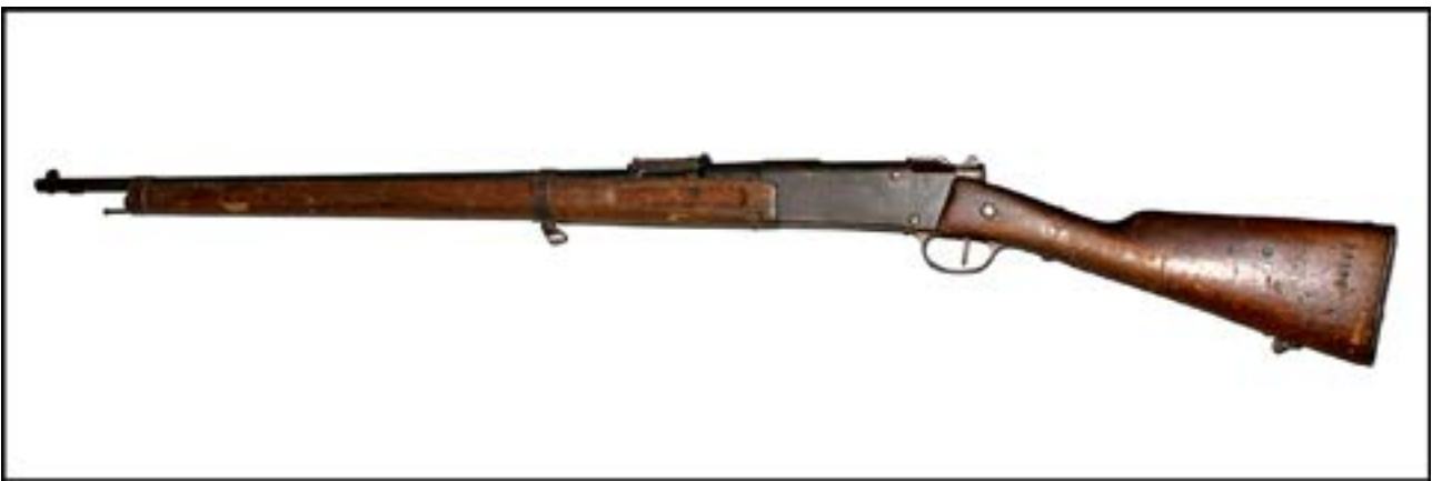
Гвинтівка Lebel M1886 [16].

Солдати Угорської королівської армії під час Другої світової війни користувалися гвинтівкою свого вітчизняного виробництва – FEG 35М. Італійські війська під час війни мали різні варіанти гвинтівки системи Манліхера – Каркано. Серед них варто відзначити карабін Mannlicher-Carcano M1891 da Cavalleria, призначений саме для кавалеристів. І угорську, й італійську гвинтівки можна бачити в експозиції залу № 13 Музею.