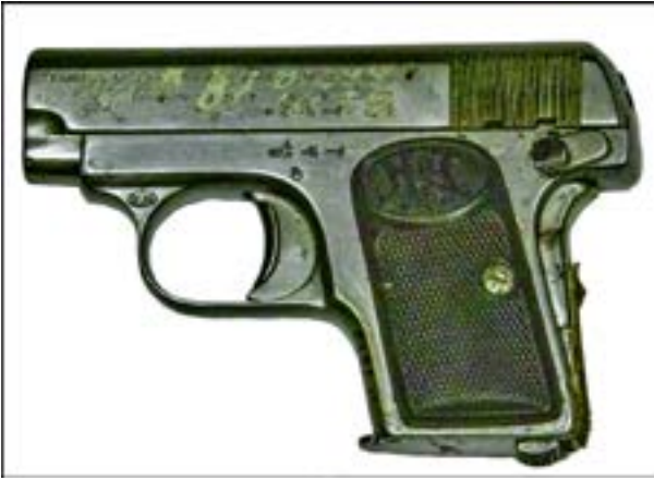
Пістолет Premier 1913 cal. 6,35 [23].