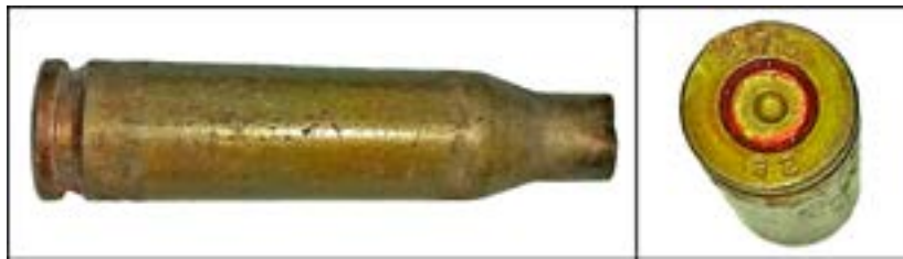
Гільза калібру 5,45 мм [56].

Автоматні гільзи калібру 5,45 мм так само легко описати. Наприклад, «270» – позначення Луганського патронного заводу, «82» – рік випуску.