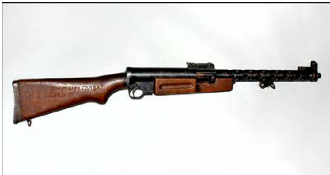
Пістолет-кулемет ZK-383 [29].

Дуже часто зброя різних періодів випусків має свої конструктивні особливості. Відповідно ранні зразки дещо відрізняються від пізніших. Це можна продемонструвати на прикладі доволі цікавого незвичного чехословацького пістолета-кулемета ZK-383, який зберігається у фондозбірні. На музейному зразку на кожуху ствола є кільце для встановлення двоногої сошки. Ця особливість відрізняє зброю ранніх випусків. Пізніші зразки сошок не мали. Пістолет-кулемет ZK-383 почали виготовляти для армії Чехословаччини в 1938 р. Відомо, що із захопленням цієї країни Вермахт узяв на озброєння й певну кількість таких пістолетів-кулеметів [7, 234]. Очевидно, під час німецько-радянської війни нинішній музейний зразок був захоплений як трофей військовослужбовцем Червоної армії. Вирізьблені слова російською на прикладі «11 німецьких солдатів і один офіцер знищив М С» та 12 зарубок на зворотному боці свідчать про результативність бійця.