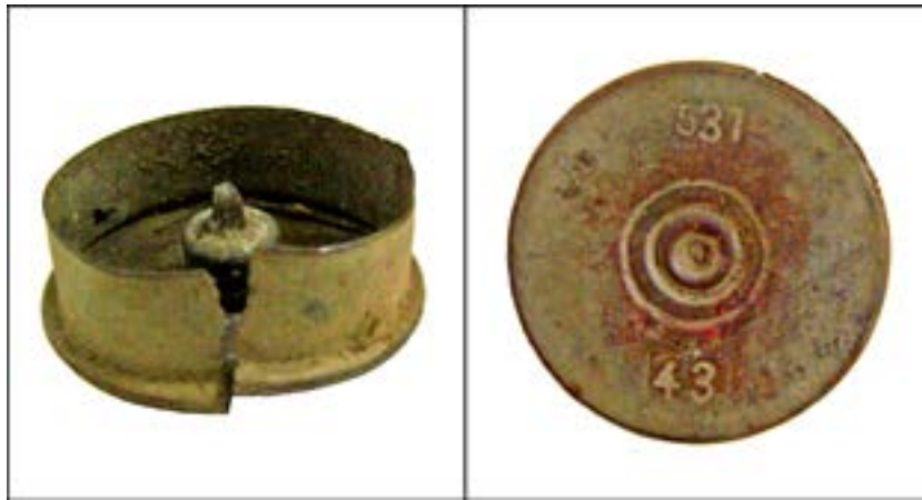
Фрагмент гільзи від патрона до сигнального пістолета калібру 26 мм [49].

Те саме можна сказати і про гільзу калібру 14,5 мм, яка була складником патрона до протитанкових рушниць Дегтярьова та Симонова: «3» – позначення Ульяновського патронного заводу, «42» – рік випуску.