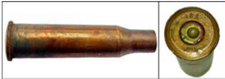
Гільза калібру 7,62 мм [54].

Автоматні гільзи калібру 5,45 мм так само легко описати. Наприклад, «270» – позначення Луганського патронного заводу, «82» – рік випуску.