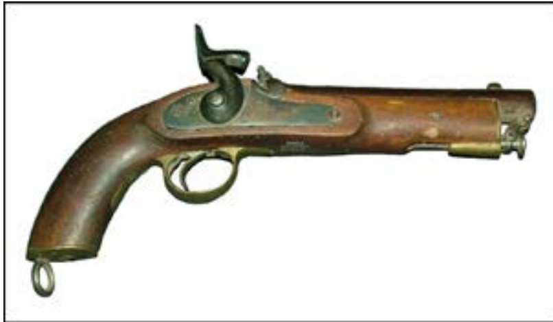
Пістолет Enfield з ударно-капсульним замком [15].

Серед інших цікавих зразків цього періоду, які використовували афганці в боротьбі з радянськими військами, був американський револьвер Merwin & Hulbert Frontier 4th Model, виготовлений між 1887 та 1891 рр. Це доволі рідкісна зброя, ціна якої на сучасних аукціонах сягає 1000 доларів США.