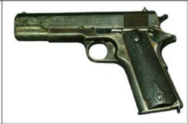
Пістолет Colt M1911 [22].

Тулський збройовий завод лише поступово освоїв технологію виробництва напівавтоматичних пістолетів. Тож добре помітною є різниця між доволі простим виглядом ТТ зразка 1930 р. (на фото нижче – ліворуч) і вельми технологічним – ТТ зразка 1933 р. (на фото нижче – праворуч). Якщо перший мав дерев'яні щічки руків'я, то останній уже виготовлявся з пластмасовими [7, 194–195].