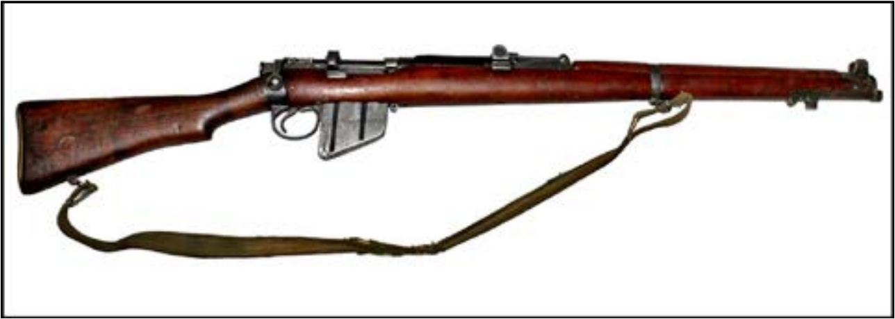
Гвинтівка Lee-Enfield No.1 Mk.III [10].