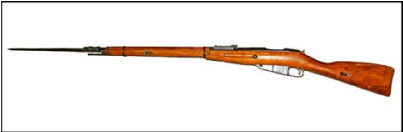
Гвинтівка системи Мосіна зразка 1891/1930 рр. [18].

У Червоній армії зброєю звичайного бійця була гвинтівка системи Мосіна зразка 1891/1930 рр., або «трьохлінійка». Їй притаманні тонкі ложе та приклад без виступу для правої руки. У Вермахті такою зброєю був карабін Mauser 98k. Його дуже легко відрізнити від гвинтівок інших систем завдяки круглому диску на прикладі. Варто зауважити, що з десятих бійців німецького піхотного відділення сім були озброєні саме цим карабіном. Тому типовий образ німецьких солдатів, які в повному складі озброєні автоматами чи кулеметами, – це не більше ніж витвір кінематографа пізніших років.