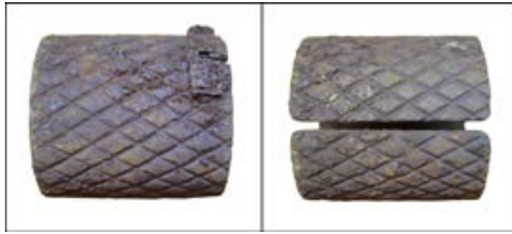
Осколковий оборонний чохол (сорочка) для ручної гранати РГД-33 [43].

Під час Другої світової війни бойове хрещення пройшла й широковідома граната Ф-1, створена на основі однойменної французької гранати часів Першої світової. Завдяки своїй надійності й простоті вона досі перебуває на озброєнні багатьох країн світу.