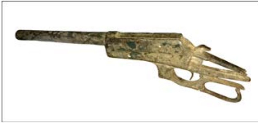
Фрагмент гвинтівки Winchester M1895. Зал № 3.