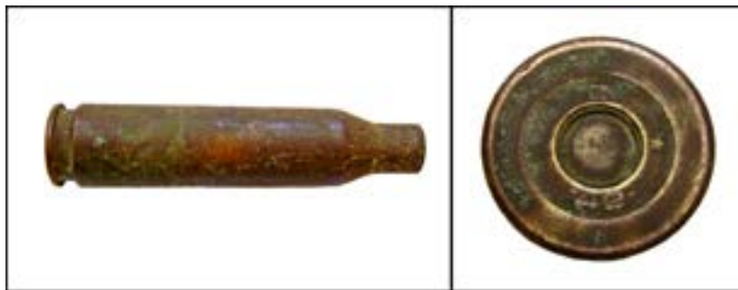
Гільза калібру 14,5 мм [46].

Те саме можна сказати і про гільзу калібру 14,5 мм, яка була складником патрона до протитанкових рушниць Дегтярьова та Симонова: «3» – позначення Ульяновського патронного заводу, «42» – рік випуску.