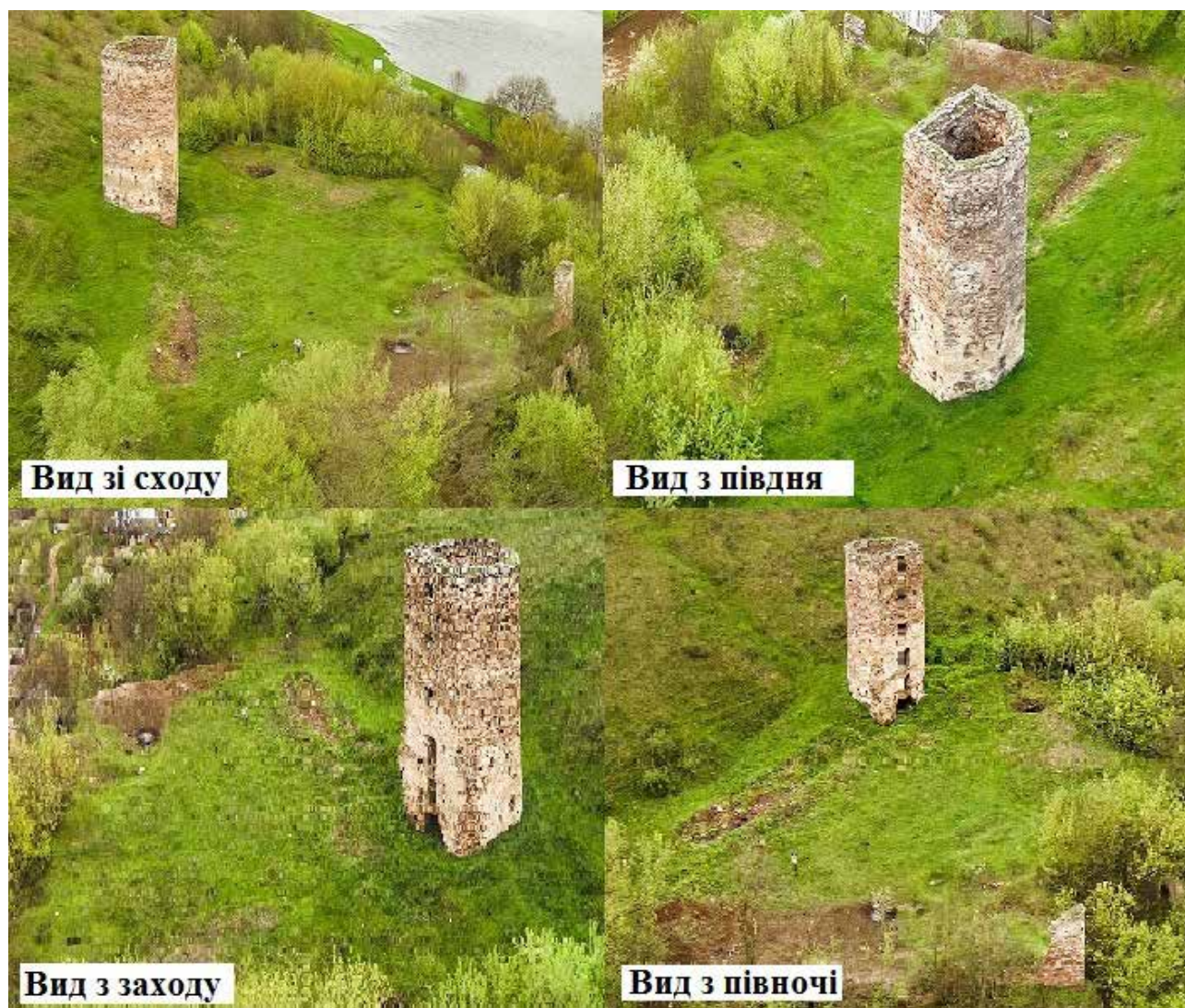
Рис. 1. Раковецький замок.

ського геоморфологічного району, для якого характерні карстові форми рельєфу, глибокі річкові долини та горбисто-хвилясті покутські височини (рис. 1). А прилегла до замкового комплексу територія – це природна зона Дністровського каньйону, що є унікальним геологічним утворенням на базі комплексу осадових товщ від найдавніших (силурійських) до наймолодших (антропогенних) відкладів. Замкова площа (висота території коливається від 192 до 207 м) знаходиться біля підніжжя гори й відрізняється різким зниженням абсолютної висоти місцевості в сторону річища Дністра (до 170 м) і збільшенням при підйомі на схил (до 280 м над рівнем моря).