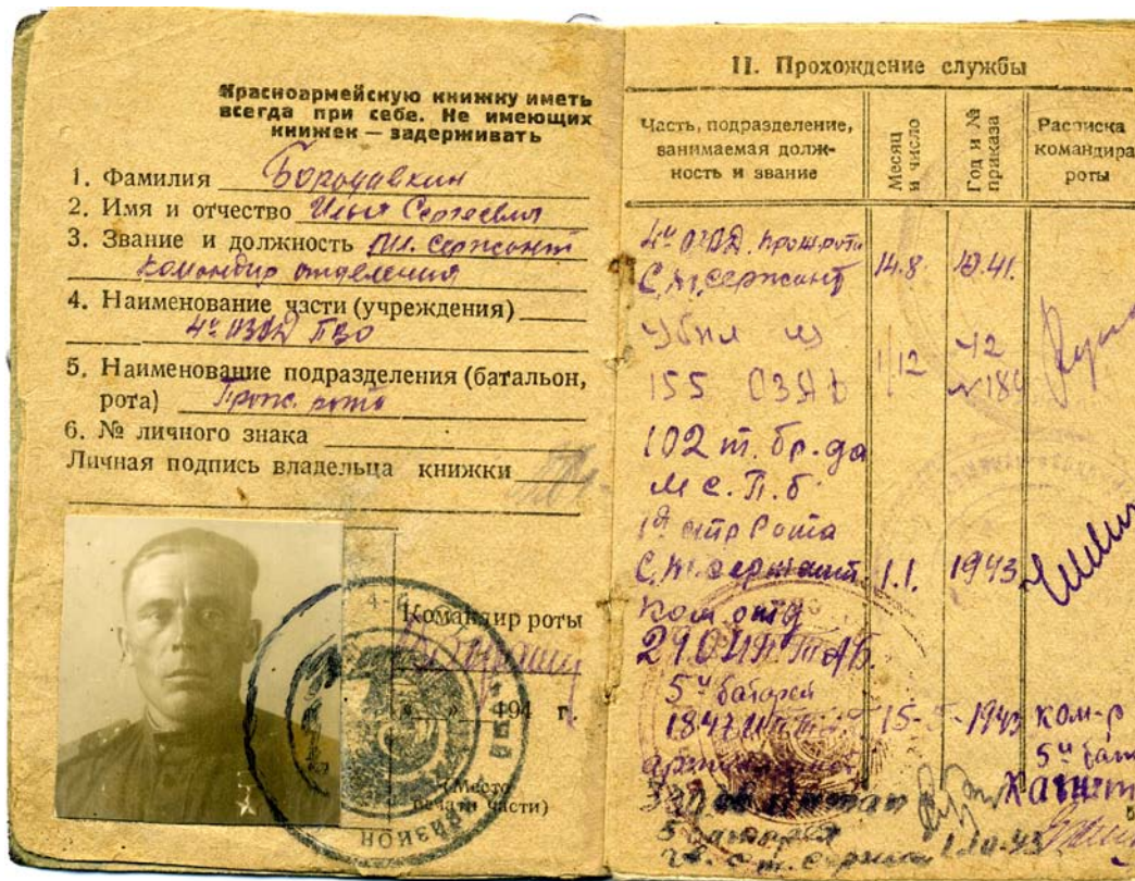
Червоноармійська книжка Героя Радянського Союзу молодшого сержанта І.С. БОРОДАВКІНА