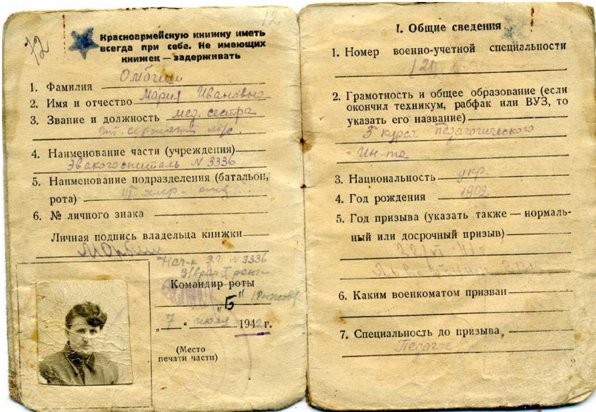
Червоноармійська книжка старшого сержанта медичної служби М.І. ОМБИШ