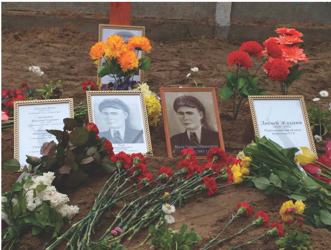
Фото. 2012 г. Во время захоронения. Киевская область 2012 г. Книга регистрации корреспонденции МКНМИВОВ – В/х № 263 от 18 мая 2012 г.