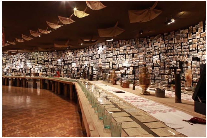
Фото из экспозиции Музея истории Великой Отечественной войны.

25 октября 1944 г. Всего 96 казахов были удостоены звания Героя Советского Союза, 67 из них награждены этой высокой наградой за освобождение Украины. Тысячи казахских матерей и жён получили извещения о том, что их сыновья, мужья пропали без вести в годы войны. Предположу, что очень многие, если не большая часть из них, погибли на территории Украины.