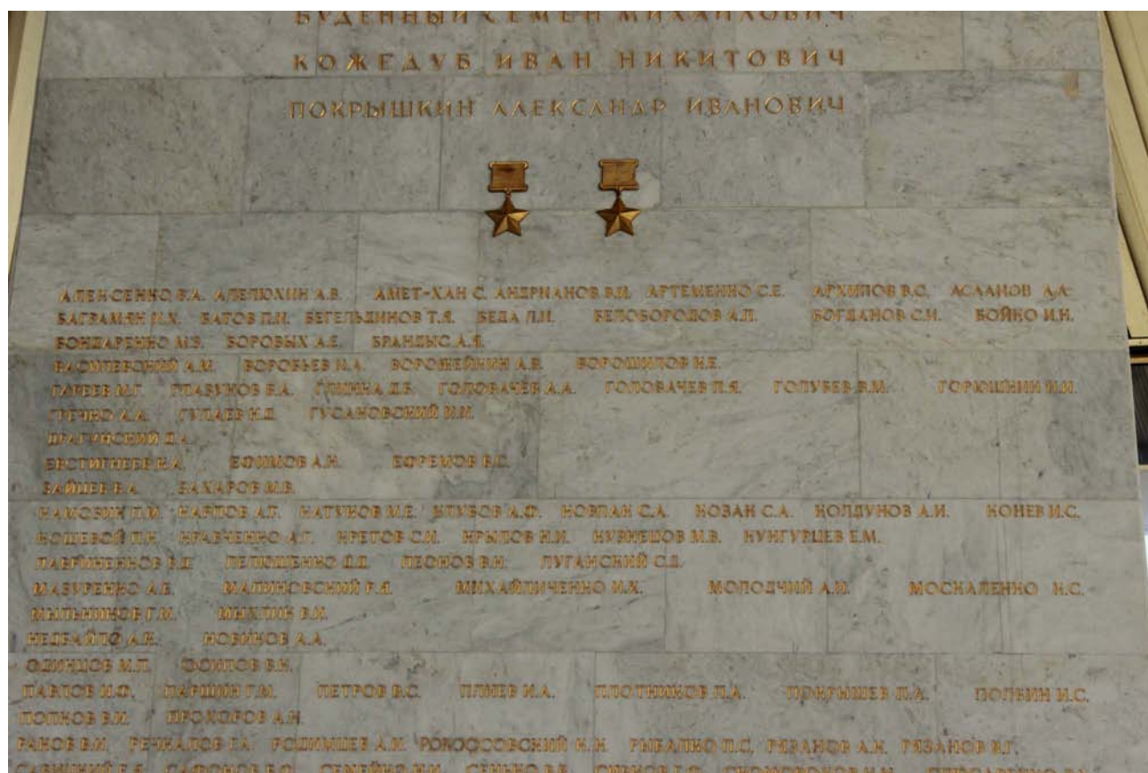
Список Героев Советского Союза в Музее истории Великой отечественной войны 1941 – 1945 годов.