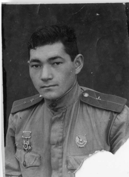
Фото. 1943 г. – Фонды МКНМИВОВ. – КП-3325. – Ф-8882.

Не имея сил сдержать усилившийся натиск советских войск, немецкие войска начали отход на Днепр. Фронты приняли все меры к тому, чтобы на