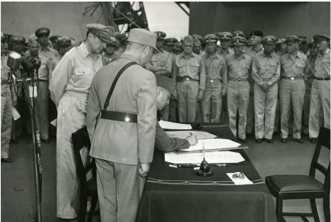
Фото 13. Су Юн-чан під час підписання Акта про капітуляцію Японії.