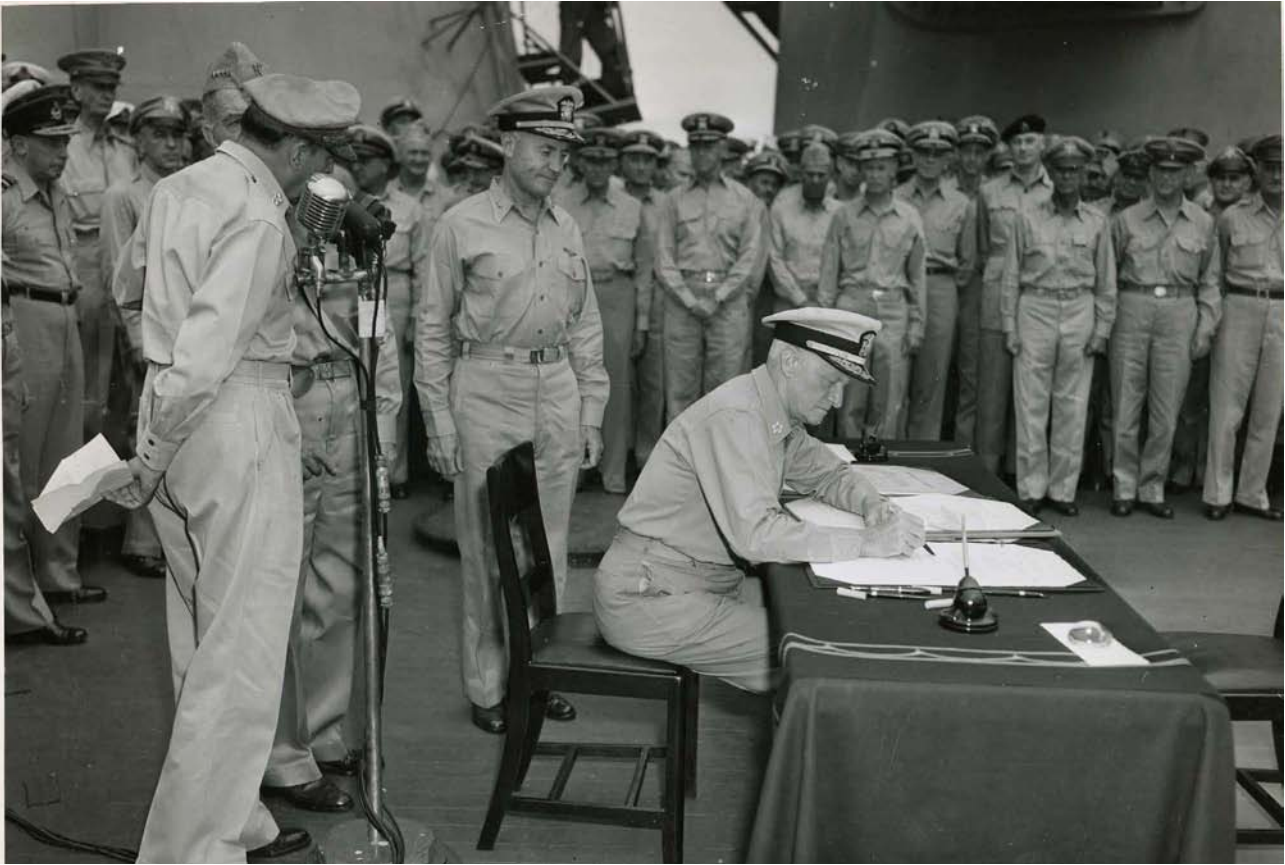
Фото 12. Честер Німіц під час підписання Акта про капітуляцію Японії.