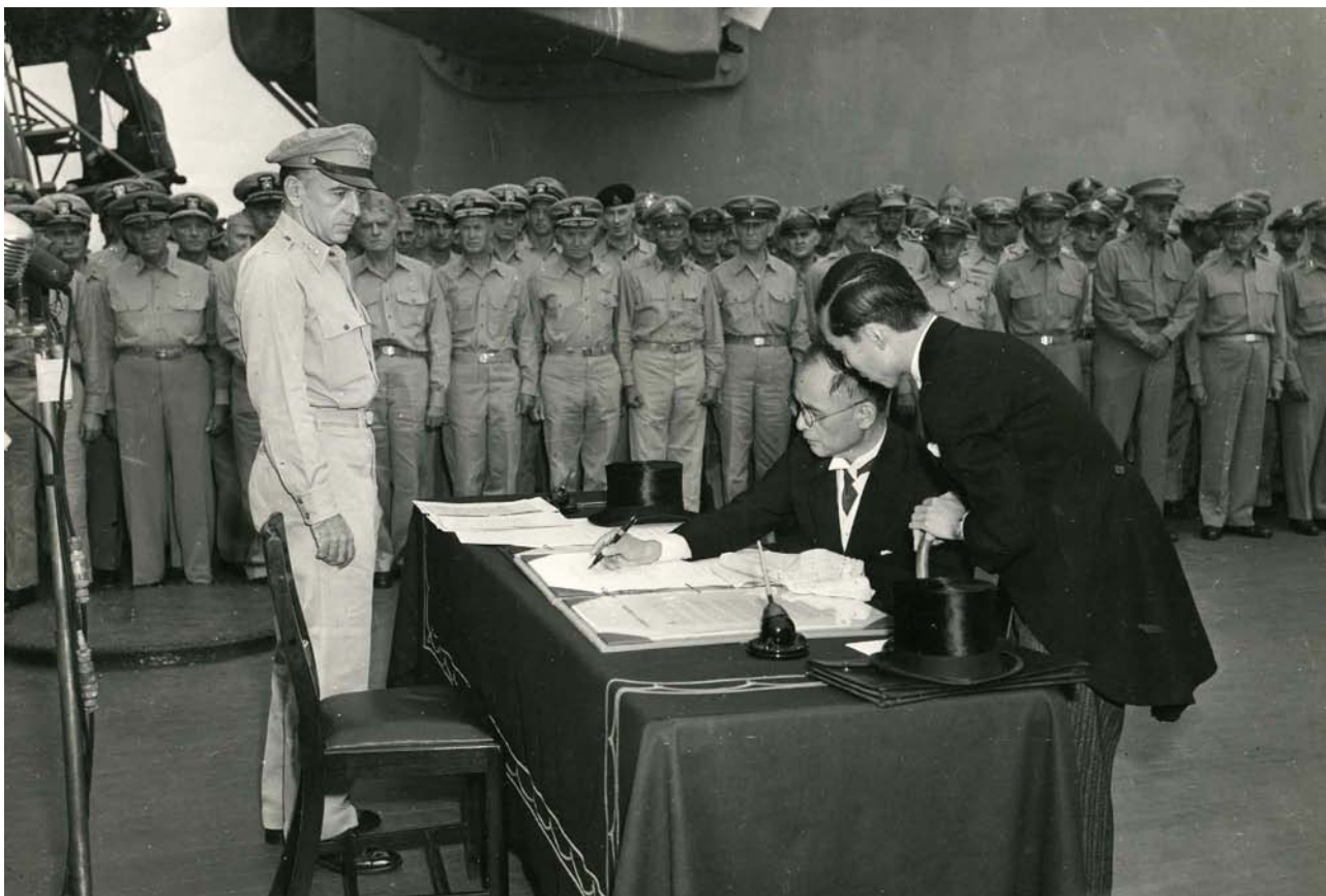
Фото 8. Сігеміцу Мамору під час підписання Акта про капітуляцію Японії.