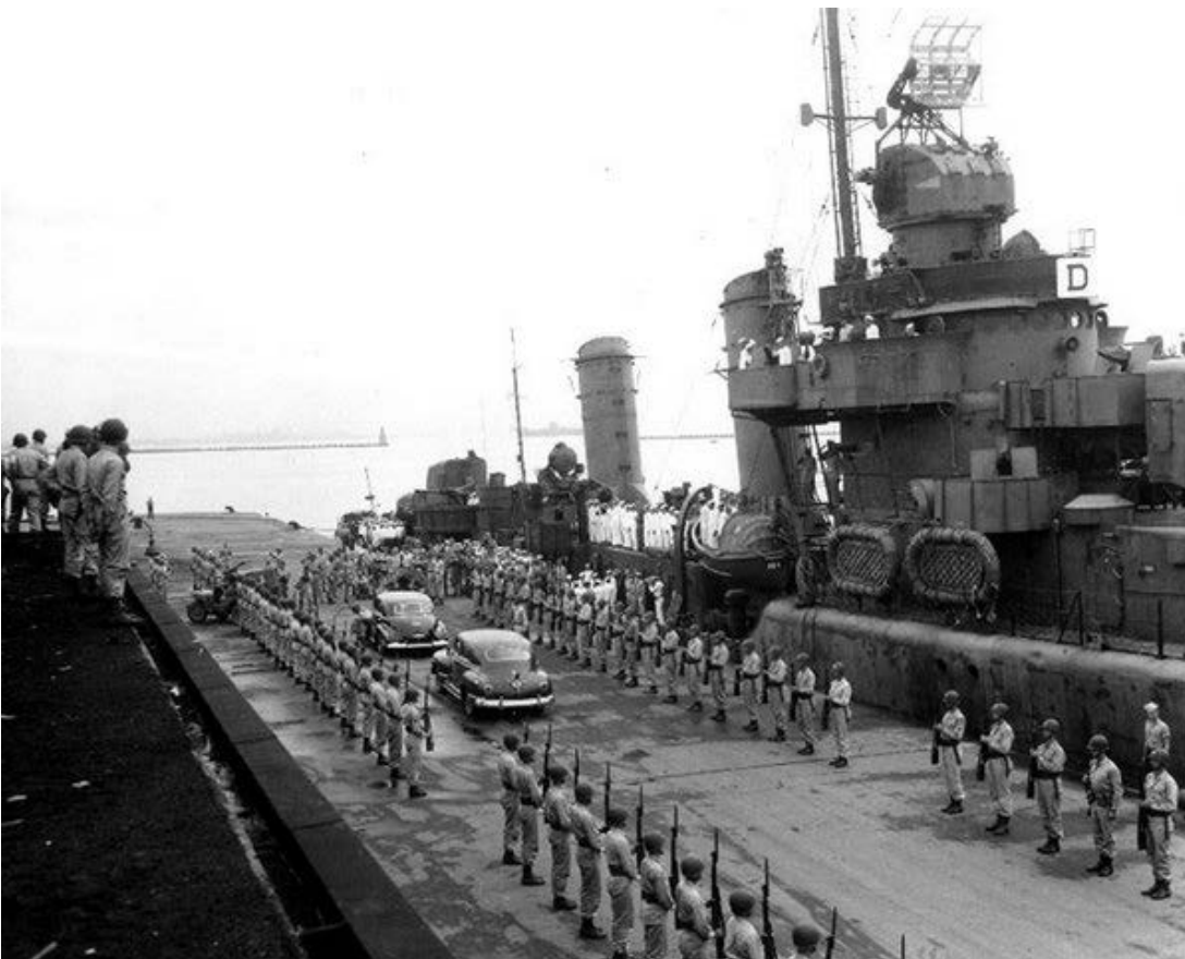
Фото 2 . Прибуття делегацій на лінкор «Міссурі».