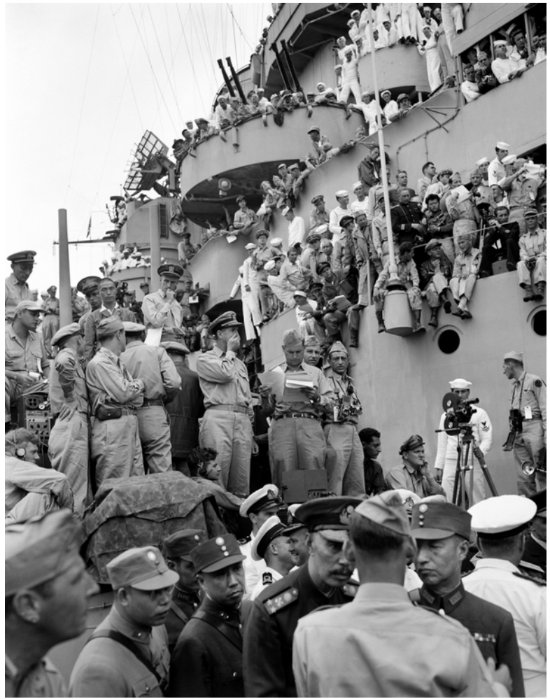
Фото 3. Військові та журналісти з різних країн на борту «Міссурі». Першим на борт «Міссурі» піднявся генерал Дуглас Макартур з американською делегацією. Офіційні представники союзних країн прибували на міноносцях.