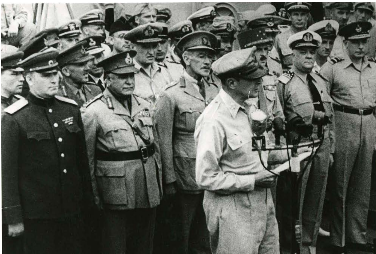
Фото 7. Генерал Д. Макартур під час відкриття церемонії.