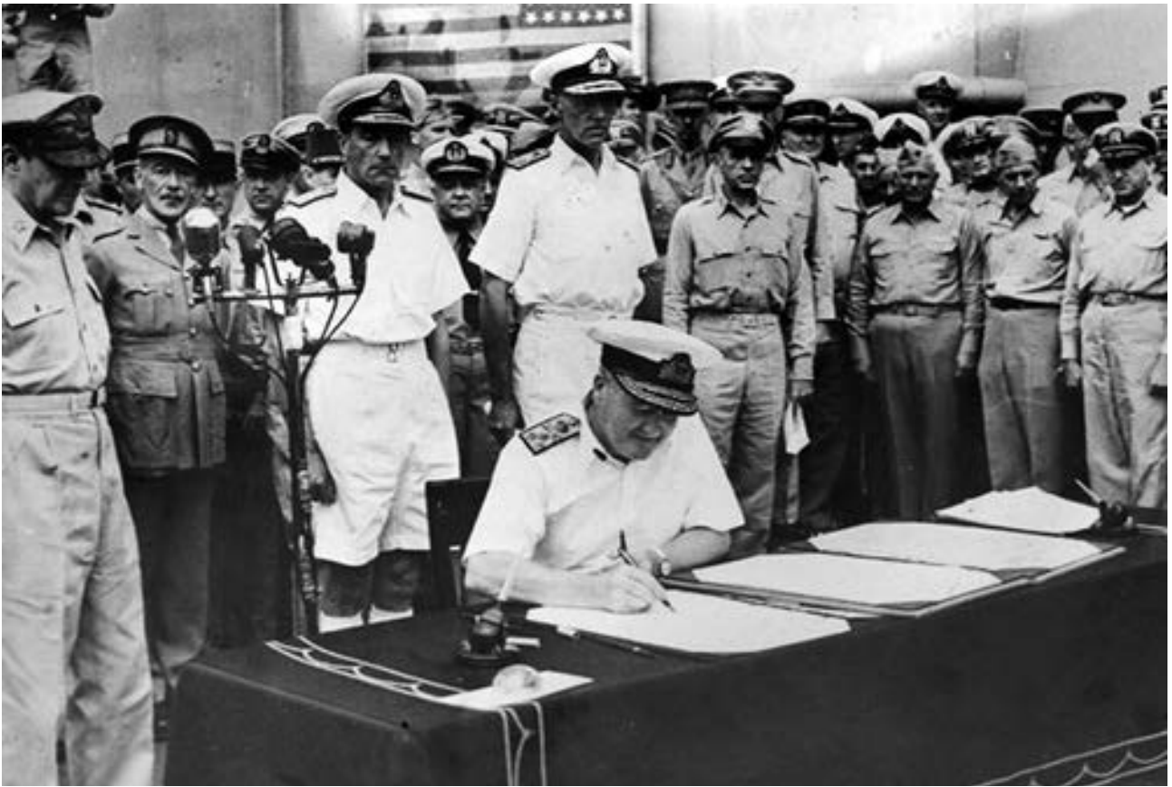
Фото 14. Брюс Фрезер під час підписання Акта про капітуляцію Японії.