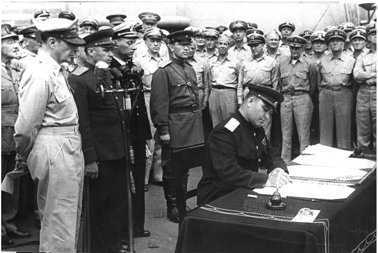
Фото 15. Кузьма Дерев'янка під час підписання Акта про капітуляцію Японії.