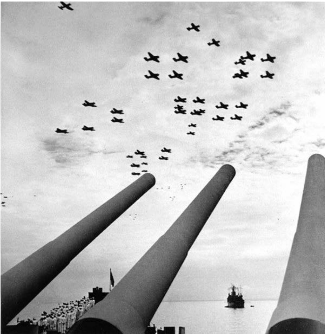
Фото 17. Повітряний парад на честь підписання Акта про капітуляцію Японії. 2.09.1945 р.