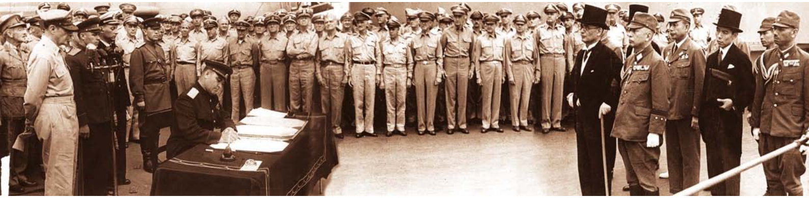
Фото 16. Підписання Акта про капітуляцію Японії представником СРСР.