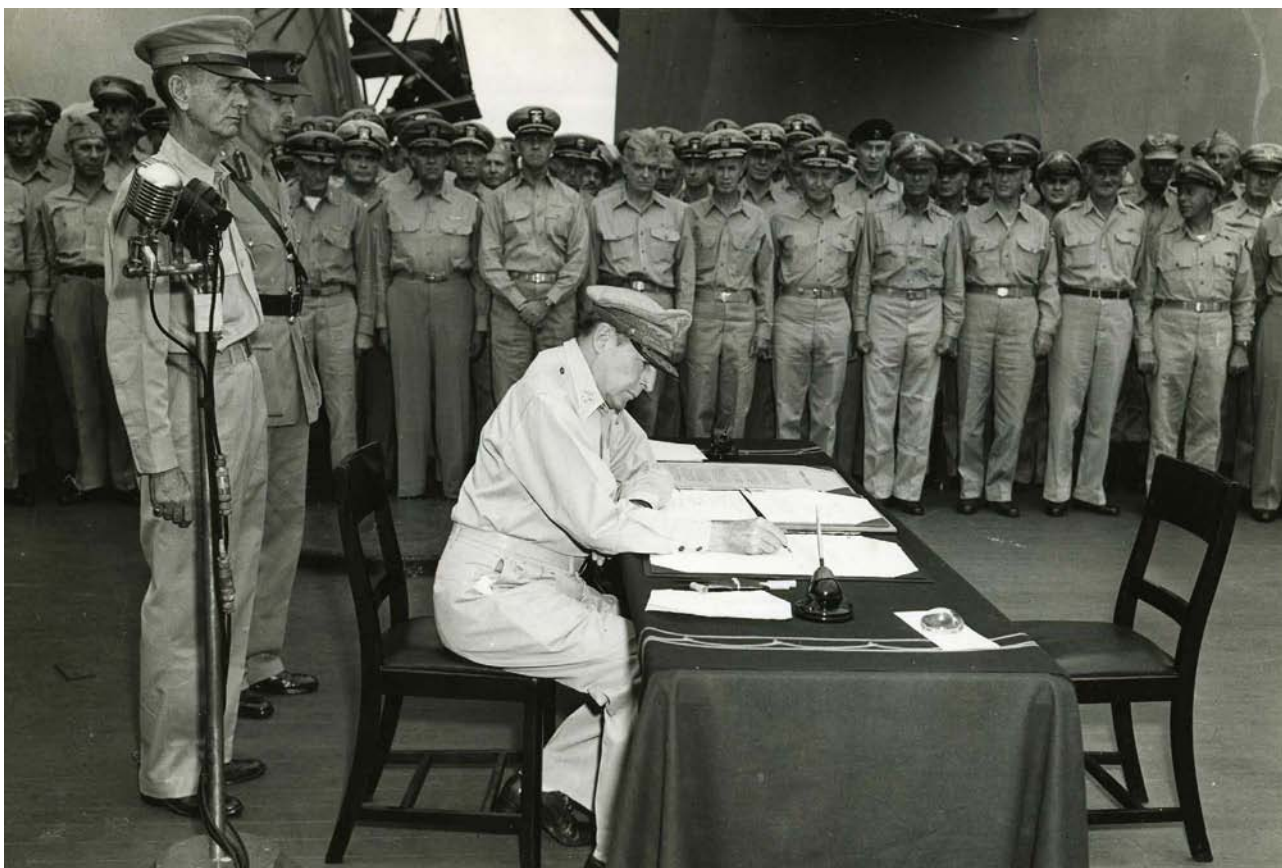
Фото 11. Дуглас Макартур під час підписання Акта про капітуляцію Японії.