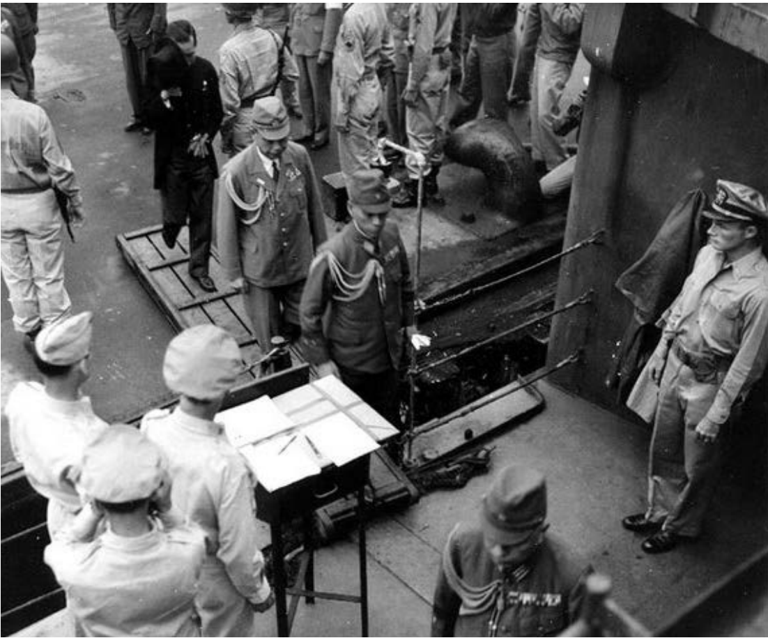
Фото 5. Японська делегація піднімається на борт лінкора.