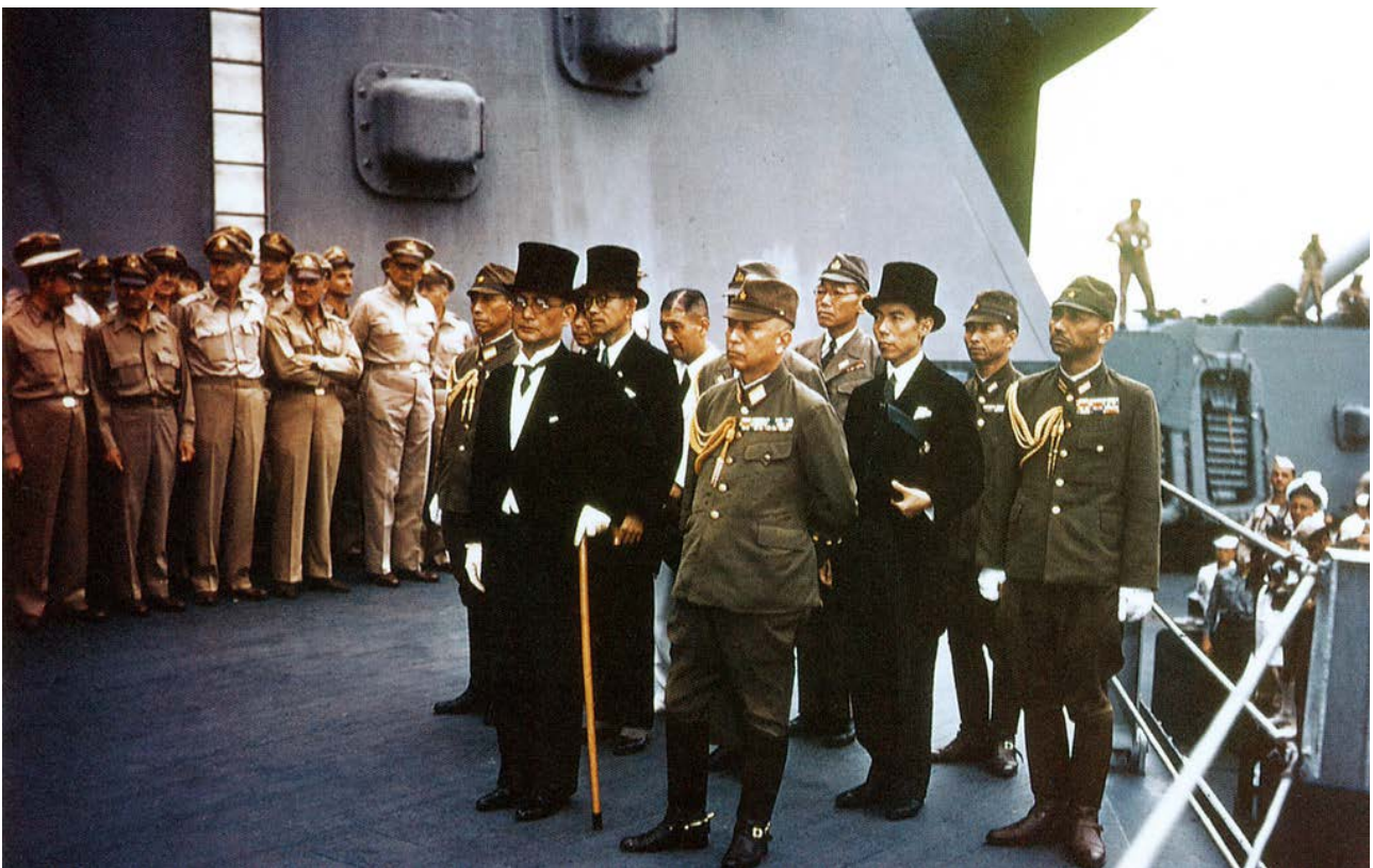
Фото 6. Японська делегація під час підписання Акта про капітуляцію Японії.