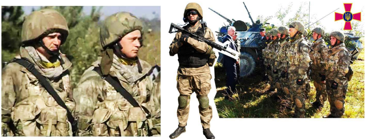
Мал. 6. Експериментальне обмундирування українських солдатів «Гірка» МК-2: «Осінньо-пустельна» версія, що була презентована на навчаннях «Перспектива-2012» [39].

До того ж перші дослідні сигнальні зразки «пiксельного» камуфляжу з погоном на грудях, на зразок бойової уніформи армії США, були випробувані восени 2012 р. на спеціальних КШН (командно-штабних навчаннях) під кодовою назвою «Перспектива-2012» на 240-му навчальному полігоні 8-го армійського корпусу [37] (Мал. 6). Найбільше позитивних відгуків у фахівців та військових підрозділів спеціального призначення отримав польовий костюм «Гірка» МК-2, який у засобах масової інформації був названий «революційним» та «ідеальним для польових умов» [38, 28].