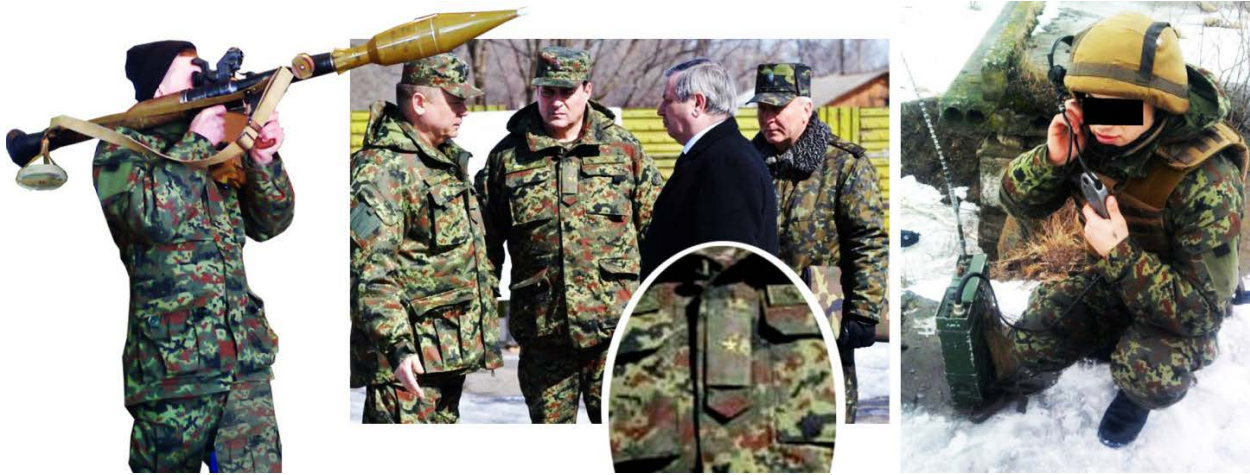
Мал. 5. Загальновійськова польова уніформа військовослужбовців ЗСУ («пiксельний» камуфляж із погоном на грудях), впровадження почато в 2013 р. [36].

На початку 2012 р. було здійснено ще одну спробу на основі досвіду НАТО і США встановити єдиний для ЗСУ новий дизайн бойового екіпірування, уніформи та камуфляжу [36] (Мал. 5).