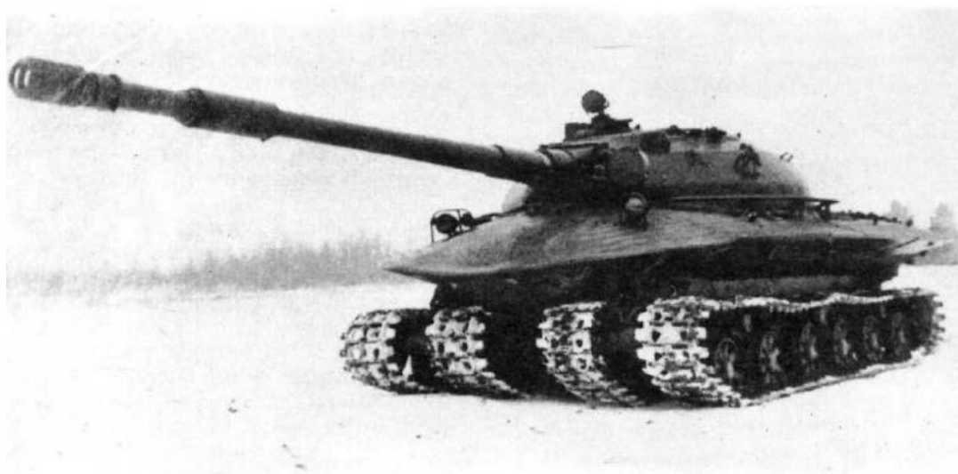
«Объект 279» на испытаниях (1959).