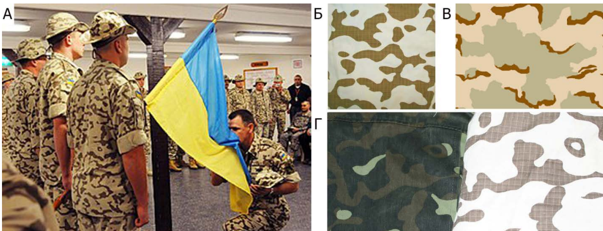
Мал. 2. Український камуфляж ТТsКО («Пустеля»), який використовували в Іраку у 2003–2008 рр. А) Церемонія закінчення української миротворчої місії в Іраку (09.12.2008) [21]. Б) Український двоколірний шаблон ТТsКО [22]. В) Камуфляжний шаблон армії США Desert 3-color [23]. Г) Коричневі плями двоколірного «пустельного» українського камуфляжного шаблону 2003 р. збігаються з коричневими плямами українського шаблону «Дубок» [22].

Хоча рух до євроатлантичної інтеграції України почався практично з моменту проголошення незалежності, все-таки перші спроби включення досягнень й елементів західних зразків, зокрема американських, в українській однострій були пов'язані з війною в Іраку (20.03.2003–15.12.2011) та виступом Києва на боці Міжнародної коаліції (11.08.2003–09.12.2008) [19, 67–84]. Приєднання України до багатонаціональної військової операції в Іраку було важливим військово-політичним кроком держави і за головну мету мало її вихід із міжнародної військово-політичної ізоляції. У виборі крою уніформи та проектуванні її камуфляжного малюнка Україна керувалася Угодою зі стандартизації (STANAG – Standardization Agreement), ухваленою в НАТО задля успішного здійснення спільних операцій. Стосовно одностроїв її реалізовано через Публікацію союзних даних 34 (ADatP-34) – стандарти та профілі взаємодії НАТО, що відображені у STANAG 2138 [20]. Ця угода обумовила затвердження в різних країнах схожого крою уніформи. Другим критерієм була зручність конструкції, розробленої у США. Найпомітнішою відмінністю обмундирування визнавали оригінальні камуфляжні шаблони та знаки розрізнення, притаманні кожній конкретній країні. Українські дизайнери вирішили поєднати в новому пустельному камуфляжі малюнок плям власного шаблону та кольори американської уніформи.