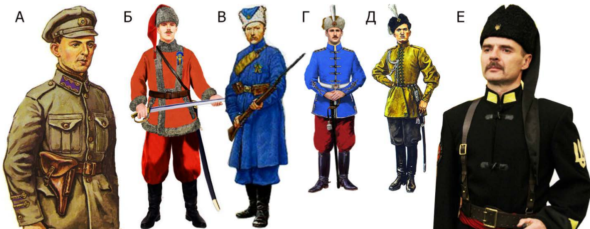
Мал. 1. Деякі національні однострої українських вояків періоду боротьби за незалежність 1918–1920 рр.: а) підполковник піхоти Галицької армії, 1919–1920 рр. [13, 25]; б) гайдамака Червоного куреня Гайдамацького коша Слобідської України, 1918 р. [12, 296]; в) вояк 1-ї Української дивізії Синьожупанників армії УНР, 1918 р. [14]; г) старшина Лубенського кінно-козацького полку армії Української Держави, 1918 р. [12, 280]; д) осавул гетьмана П. Скоропадського, 1918 р. [13, 23]; е) старшина кінного полку Чорних Запорозжців, 1918 р. [15].

Україна стала незалежною 24 серпня 1991 р., але впродовж майже чверті століття уніформа нової національної армії практично не змінювалася, зберігаючи основні риси Збройних сил СРСР, або, пізніше, копіюючи обмундирування армії Російської Федерації [11]. Це жодною мірою не було виправдано, бо країна мала зразки створення цілої низки національних одностроїв у різні періоди боротьби за незалежність (Мал. 1), а також показовий приклад армій провідних країн Європи й Америки в забезпеченні особового складу сучасним обмундируванням, яке гарантує надійне маскування, індивідуальний захист та ідентифікацію на полі бою, комфорт і зручність у повсякденній життєдіяльності [12].