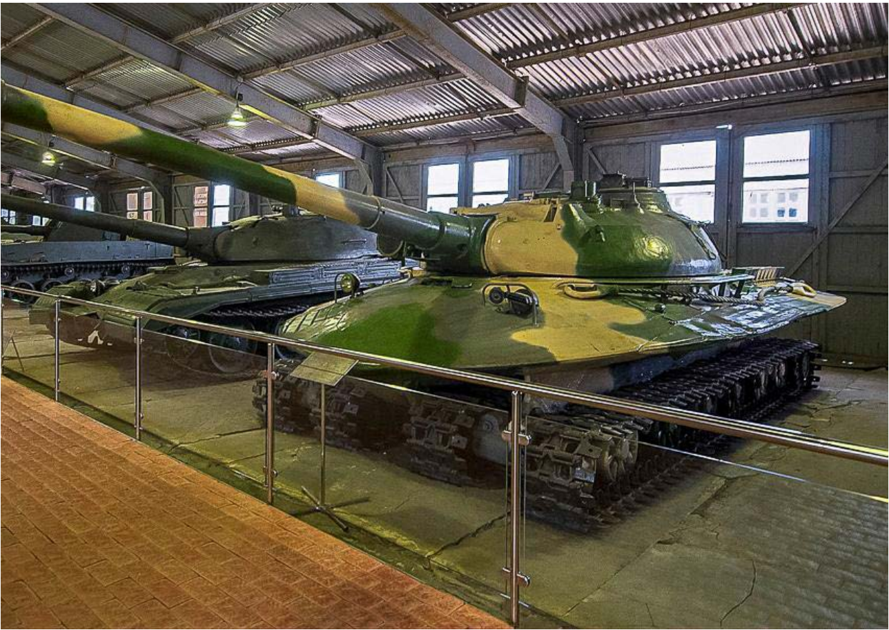
«Объект 279» в бронетанковом музее в г. Кубинка (Россия).