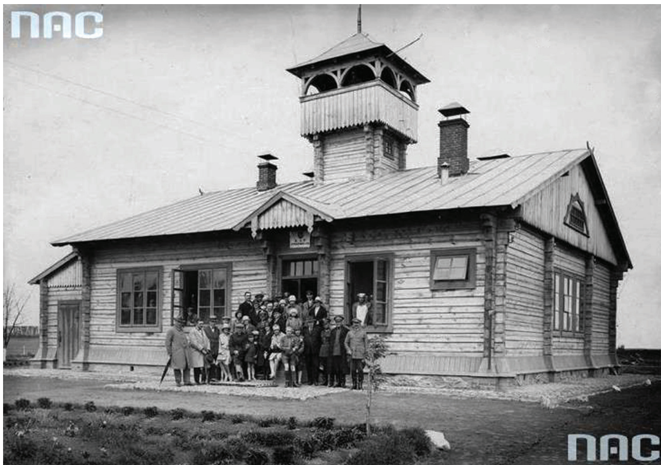
Будинок однієї з прикордонних застав 2-ї роти батальйону КОП «Гоца» поблизу міста Корець.

Упродовж двох з половиною тижнів від початку війни з Німеччиною польські прикордонники на східних рубежах несли службу у звичному режимі. Однак вранці 17 вересня 1939 р., виконуючи таємні домовленості пакту Ріббентропа-Молотова, Червона армія перейшла кордон Другої Речі Посполитої й почала швидко просуватися в глиб її території.