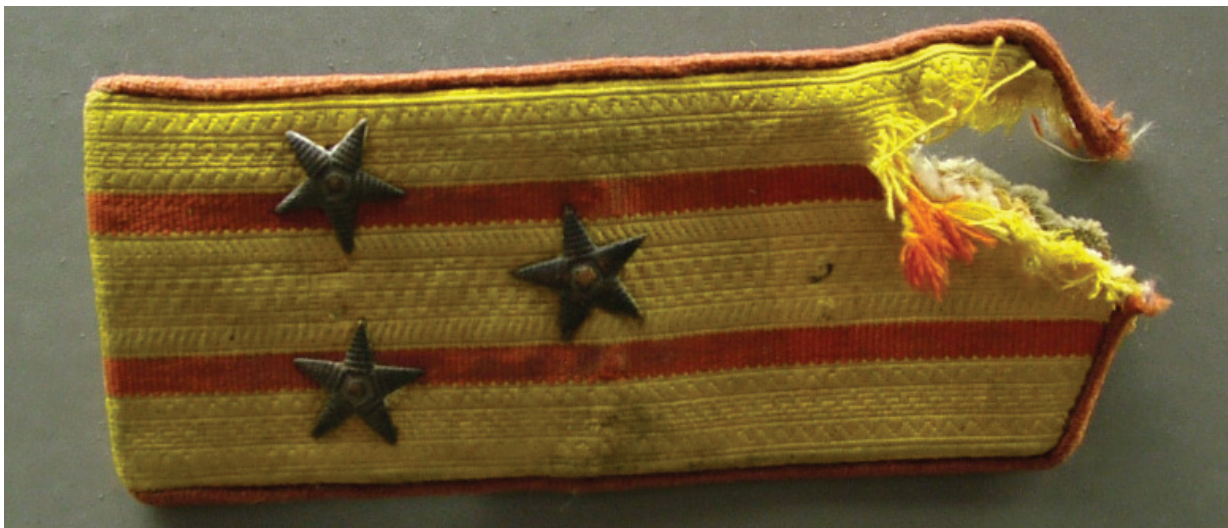
Пробитий осколком погон Героя Радянського Союзу полковника А.Х. Бабаджаняна

У роки Великої Вітчизняної війни частини, якими командував А.Х. Бабаджанян, пройшли славний бойовий шлях від Смоленська до Берліна, 15 разів відзначалися в наказах Верховного Головнокомандувача. Амазасп Хачатурович за вмиле командування військами в ході форсування Дністра, особисту мужність 26 квітня 1944 р. був удостоєний звання Героя Радянського Союзу [29].