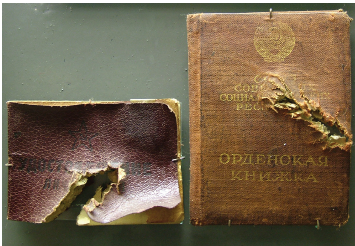
Пробиті осколками в останньому бою посвідчення особи й орденська книжка двічі Героя Радянського Союзу полковника О.О. Головачова. 1943 р.