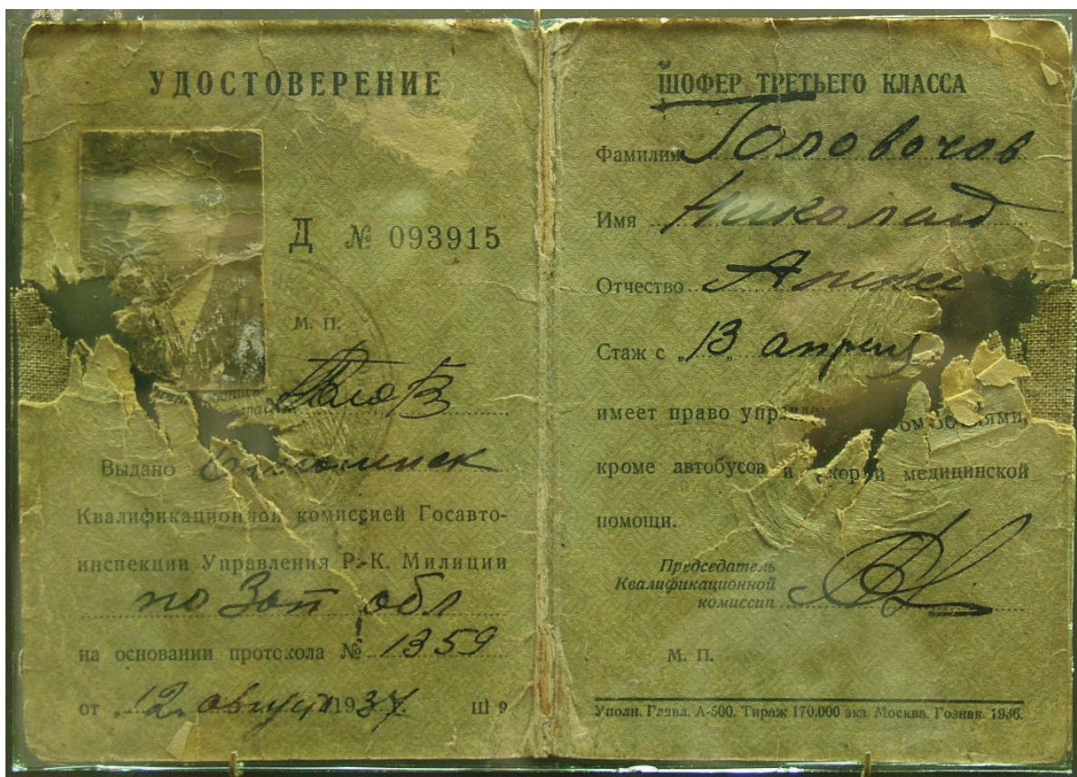
Пробите осколком посвідчення водія М.О.Головачова. 1937 р.