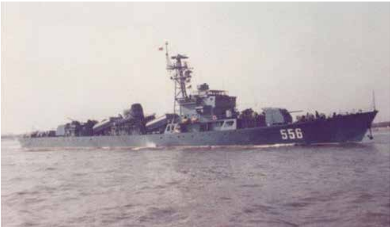
Рис. 7. Китайський фрегат із протикорабельними ракетами (проект 053Н1)

О 09.15 цього ж дня з в'єтнамського озброєного судна HQ 605 на риф Гордон була здійснена спроба висадити ще один десант, однак їй перешкодив китайський фрегат БН 556 (проект 053Н1). О 09.37 останній в'єтнамський корабель HQ 605 затонув. Загалом втрати В'єтнаму становили: в особовому складі 64 загиблих, кілька десятків полонених та усі три одиниці корабельної амфібійно-десантної тактичної групи.