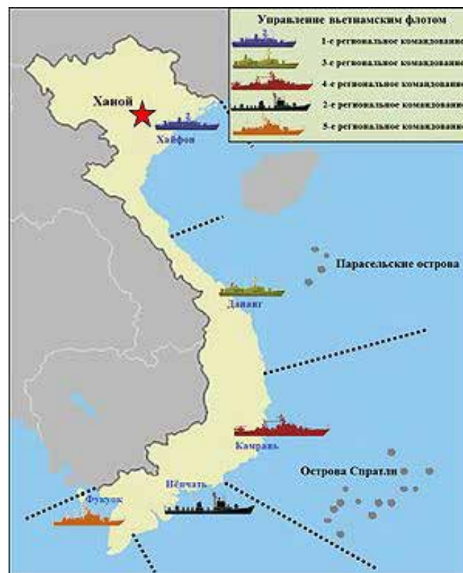
Рис. 3. Операційні зони ВМС В'єтнаму