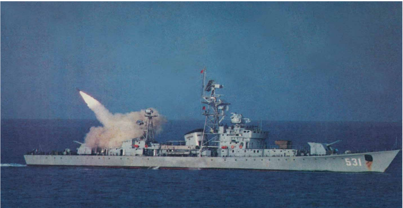
Рис. 6. Китайський фрегат 531 проекту 053К

О 09.15 цього ж дня з в'єтнамського озброєного судна HQ 605 на риф Гордон була здійснена спроба висадити ще один десант, однак їй перешкодив китайський фрегат БН 556 (проект 053Н1). О 09.37 останній в'єтнамський корабель HQ 605 затонув. Загалом втрати В'єтнаму становили: в особовому складі 64 загиблих, кілька десятків полонених та усі три одиниці корабельної амфібійно-десантної тактичної групи.