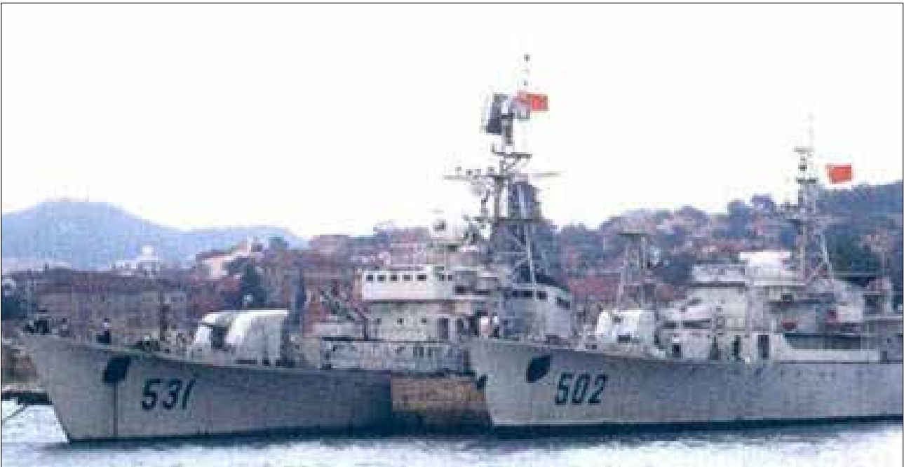
Рис. 4. «Переможці» стали музейними експонатами

Після першої перемоги китайські кораблі БН 502 та БН 531 зосередили артилерійський вогонь на ТДК НQ 505, який після пожежі викинувся на коралові рифи.