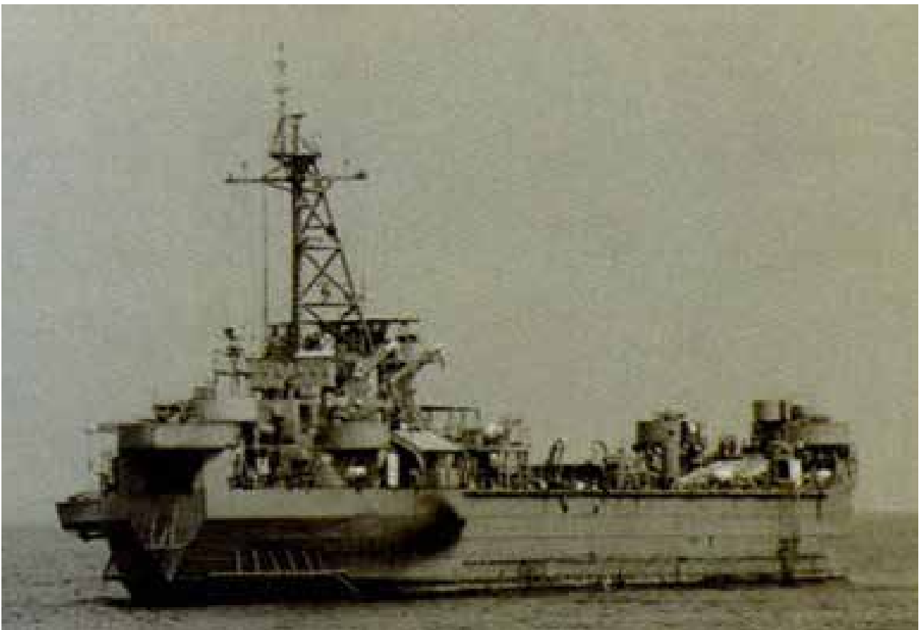
Рис. 5. В'єтнамський танко десантний корабель НQ 505

Після першої перемоги китайські кораблі БН 502 та БН 531 зосередили артилерійський вогонь на ТДК НQ 505, який після пожежі викинувся на коралові рифи.