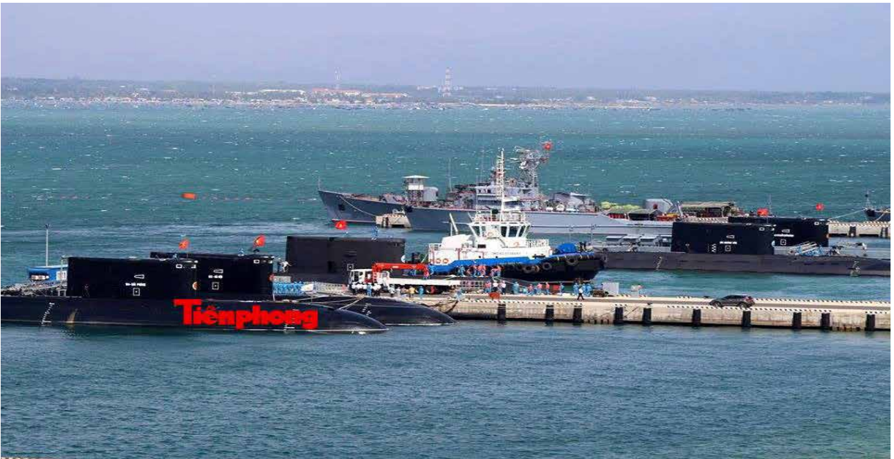
Рис. 8. ВМБ Кам-Рань: 189-та бригада підводних човнів пр.636.1

Через відсутність практичного досвіду у в'єтнамських підводників та задля збереження моторесурсу ці підводні човни були доставлені кількома рейсами голландських спеціалізованих суден-ліхтеровозів із Балтики до пункту постійного базування (див.нижче).