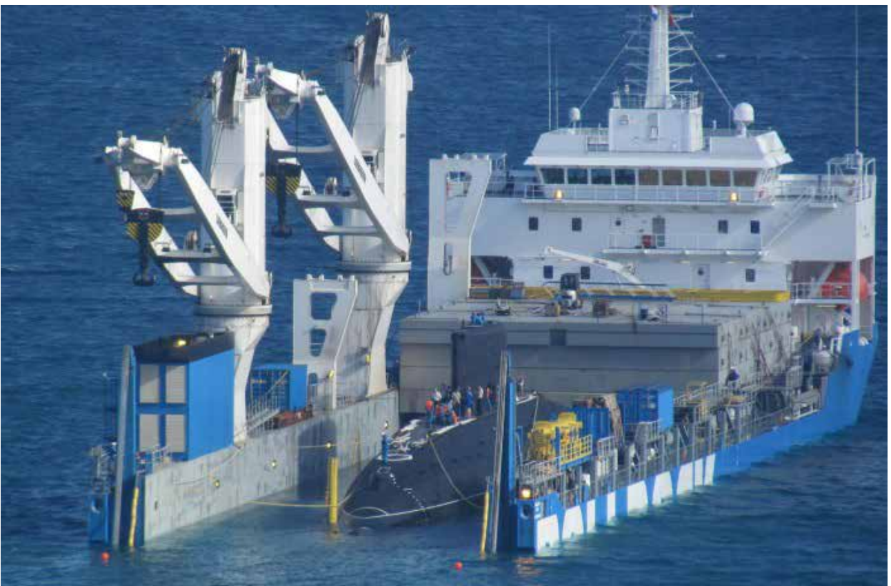
Рис. 9. Доставка підводних човнів ВМС В'єтнаму до ВМБ Кам-Рань

Через відсутність практичного досвіду у в'єтнамських підводників та задля збереження моторесурсу ці підводні човни були доставлені кількома рейсами голландських спеціалізованих суден-ліхтеровозів із Балтики до пункту постійного базування (див.нижче).