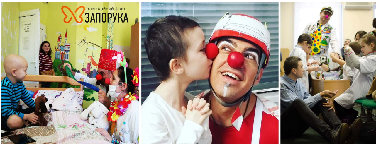
Додаток 4. Групові та індивідуальні форми роботи з хворими дітьми [21;23].