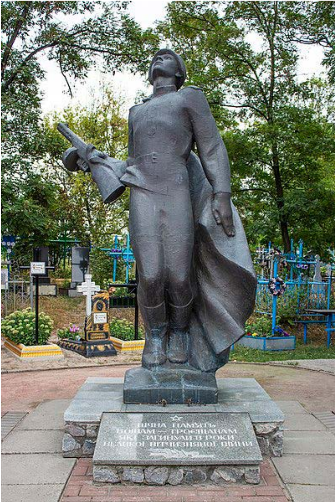
Пам'ятник «Вічна пам'ять воїнам-тросщанам, які загинули в роки Великої Вітчизняної війни».