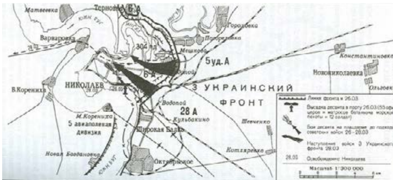
Бойові дії десантного загону 384-го ОБМП під час звільнення м. Миколаїв 26-28 березня 1944 р. [26]