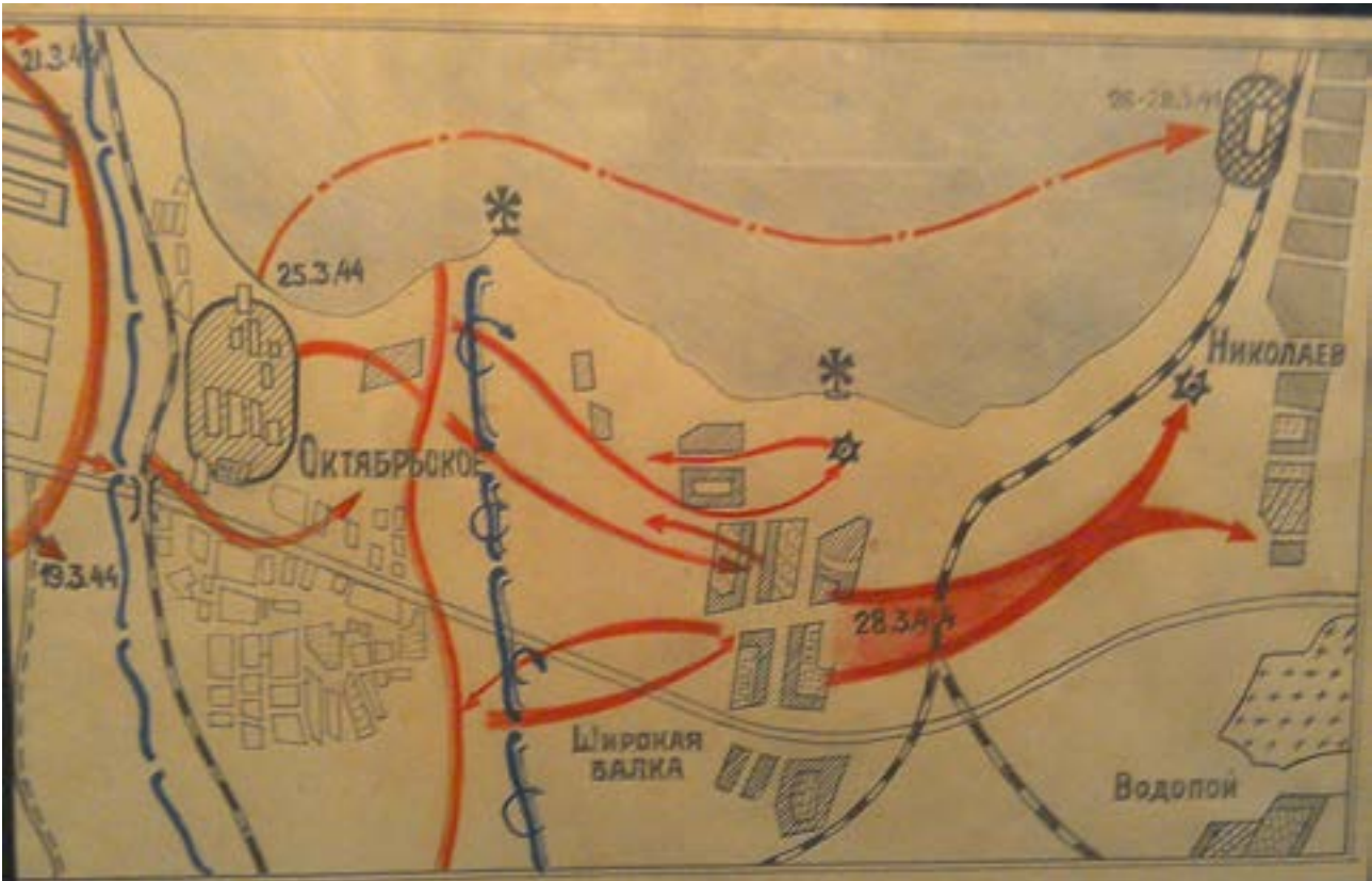
Карта-схема 15-км десантного маршруту загону К.Ф. Ольшанського 25-26 березня 1944 р. проти течії р. Південний Буг від с. Богоявленське до воріт Миколаївського морського порту (з експозиції Музею Героя Радянського Союзу К.Ф. Ольшанського, смт Приколотне Великобурлуцького району Харківської області)