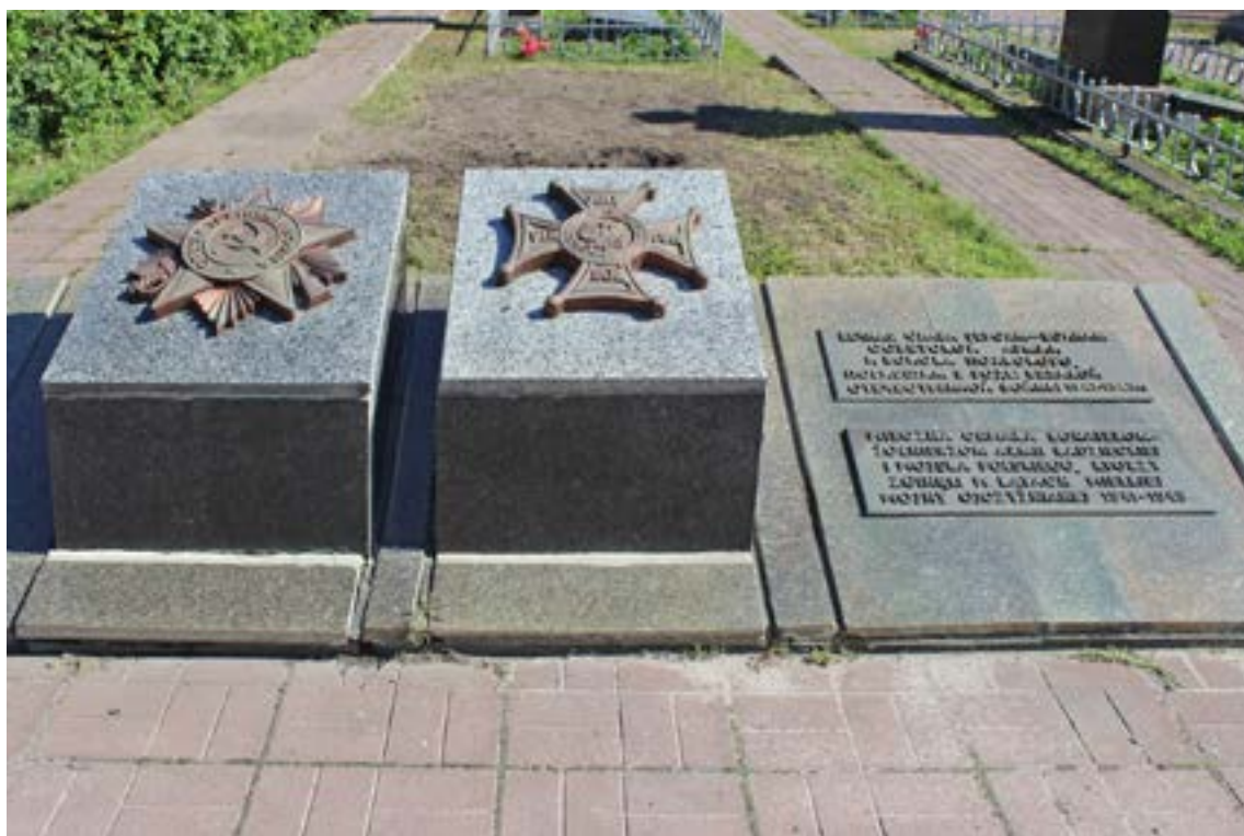
Вхід до військового меморіалу на честь польських воїнів на Дарницькому кладовищі

У 1954 р. на честь польських воїнів на Дарницькому кладовищі було відкрито військовий меморіал, вхід до якого позначений плитами з бронзовими орденами: радянським – «Вітчизняної війни», та польським – «Virtuti military» і плитою з написом-присягою російською та польською мовами з гербом Польської Народної Республіки.