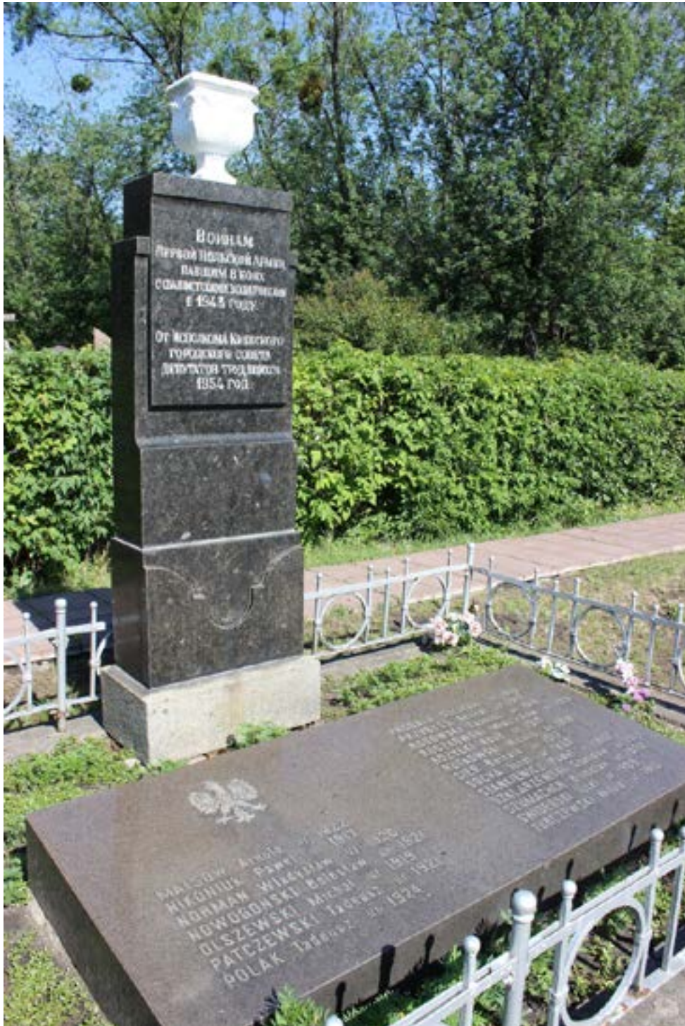
Обеліск та надмогильна плита на похованні польських воїнів на Дарницькому кладовищі

Від виконкому Київської міської ради депутатів трудящих 1954 р.». Під кожним обеліском розміщені надмогильні плити, на яких викарбувані польською мовою прізвища та імена загиблих бійців із датами народження, проте без зазначення воїнського звання