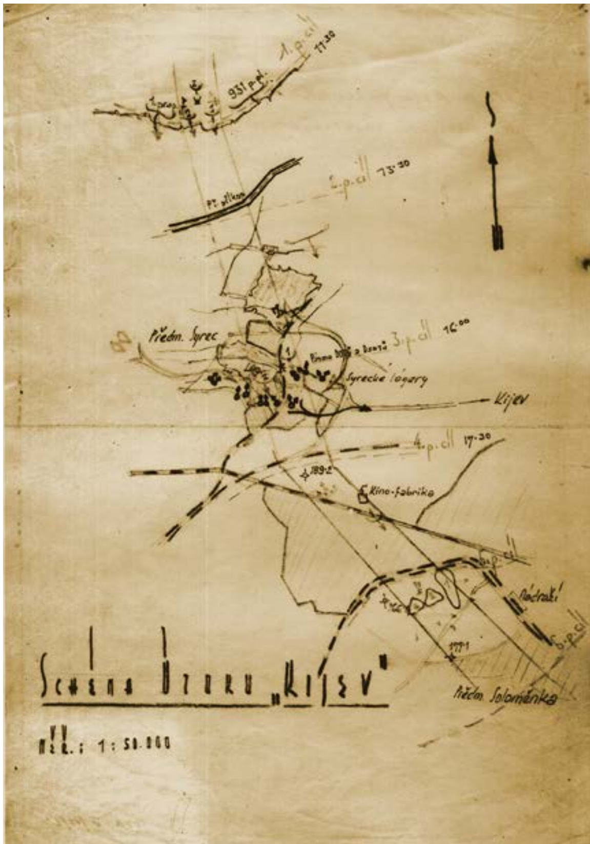
Схема наступу на м. Київ 1-ї Чехословацької окремої бригади. 1943 р.

му прапорі Чехословацької військової частини в СРСР, якою командує генерал Свобода. Вона героїчно билася під Харковом, під Києвом. Хоробрі чехословаки знали, що їхній шлях лежить до Праги» [14].